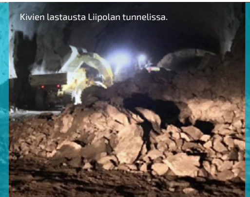
Kivien lastausta Liipolan tunnelissa.

VIIKON ONNISTUMISET: Liipolan tutkimus- tunnelien välisen tunneliosuuden puhkaisu!