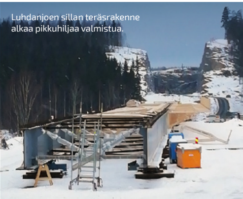
Luhdanjoen sillan teräsrakenne alkaa pikkuhiljaa valmistua.

VIIKON ONNISTUMISET: Soramäen louhinnat pääosin valmistuneet!