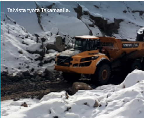
Talvista työtä Takamaalla.

VIIKON ONNISTUMISET: Maaleikkaustyöt tehty Patiokalliolta Okeroisten urakka- rajalle.