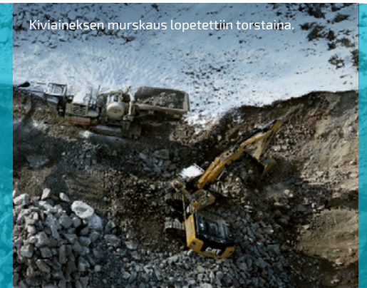
Kiviaineksen murskaus lopetettiin torstaina.

VIIKON ONNISTUMISET: Rakennustyöt etenevät!