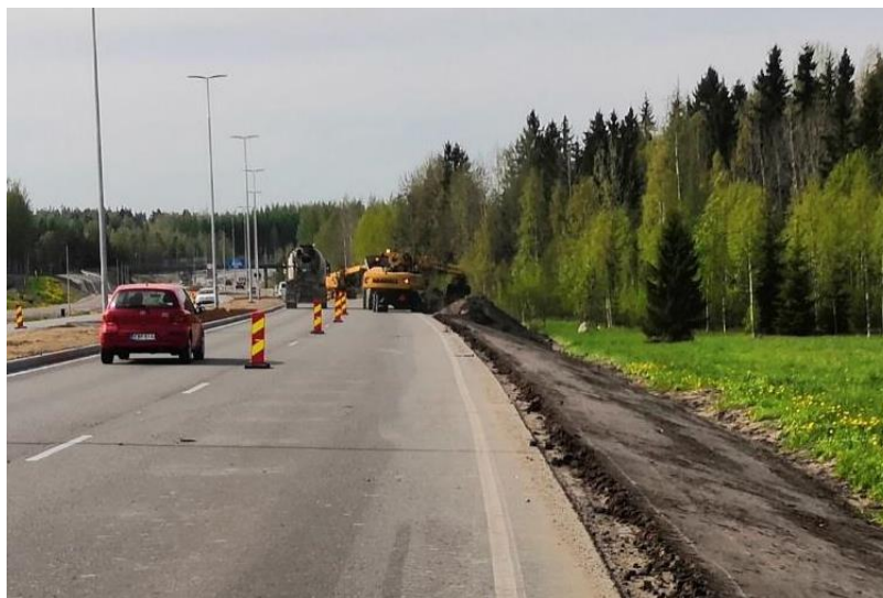
Kuva 6. Mullan levitystä Uudenmaankadulla