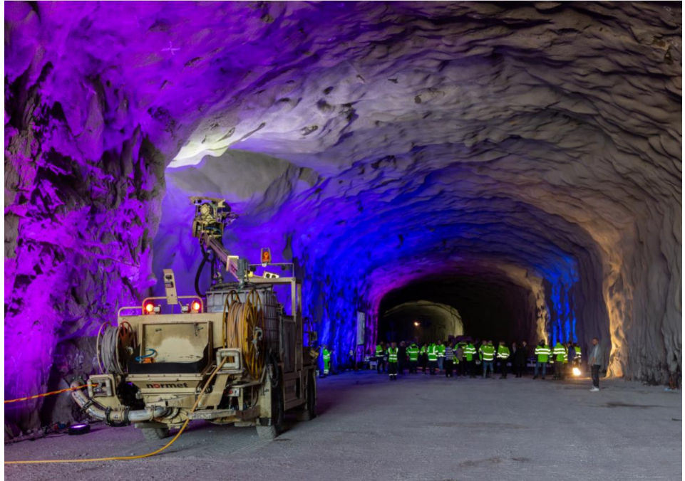
Kuva 4. Liipolan tunnelin pohjan tervajaisia vietettiin 16.5.2019.