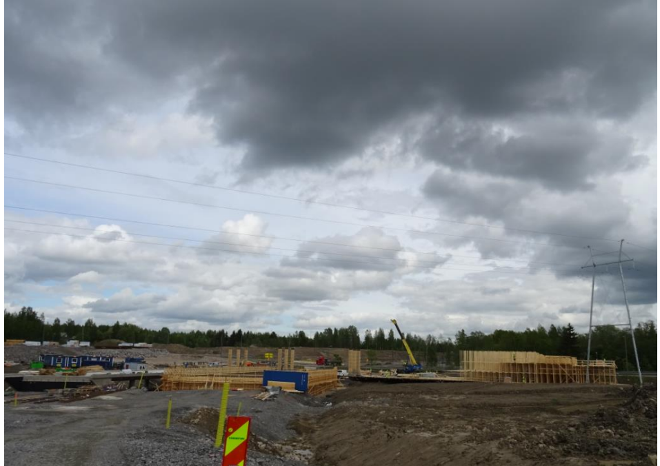
Kuva 1. Okeroisten eritasoliittymä, oikealla Okeroisten risteysillan teline rakentumassa