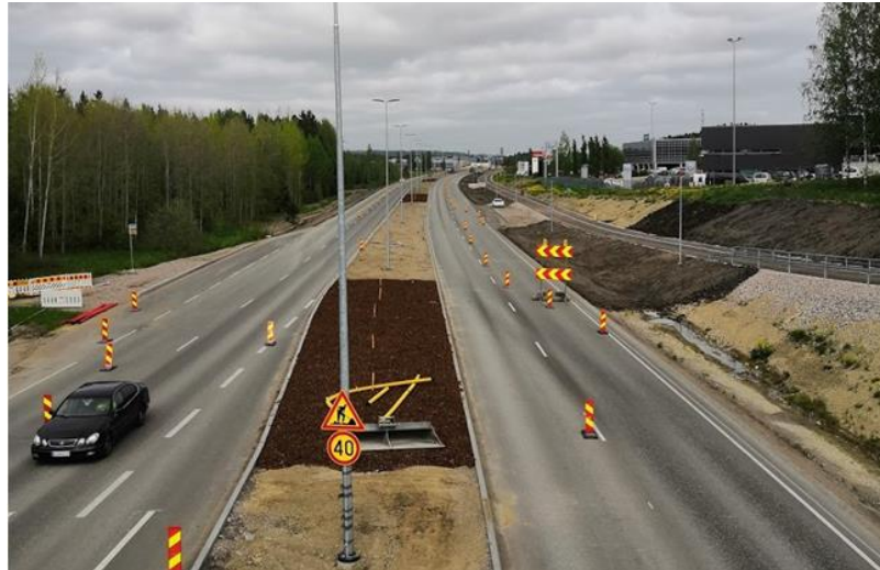
Kuva 5. Uudenmaankatu Venetsian ylikulkusillalta pohjoiseen