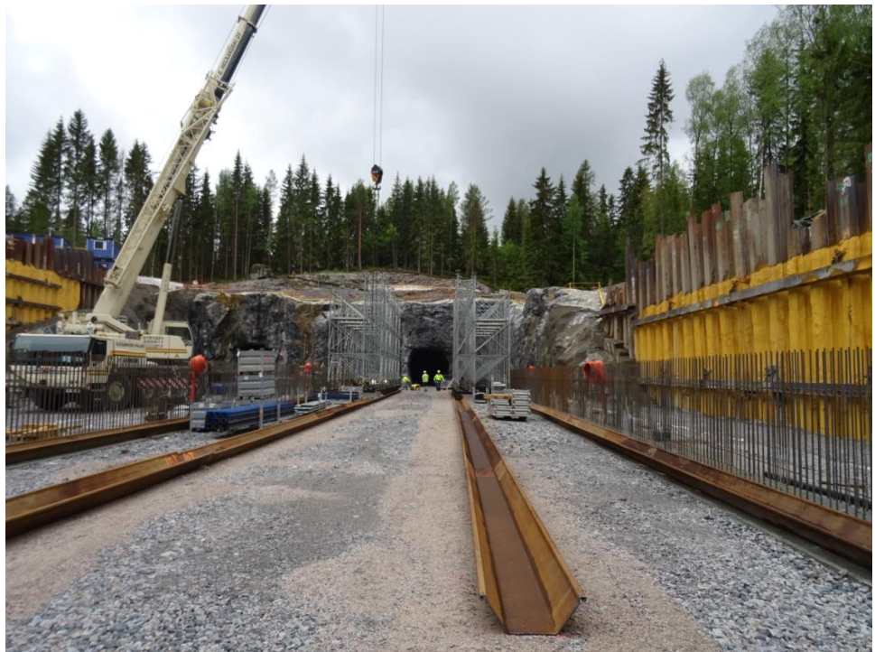
Kuva 3. Liipolan välitunneli

Sillanrakennustöitä tehtiin usealla sillalla: Kujalan risteyssillan teline nousee kovaa vauhtia ja valtatiellä 4 on käynnissä myös sillankorjaustyöt kahdella sillalla. Porvoonjoen ylittävillä Ali-Juhakkalan silloilla tehtiin muottitöitä, ja massansiirtoja helpottaa rakennettu työsilta. Hankealueen länsilaidalla tehtiin maanleikkaustöitä.