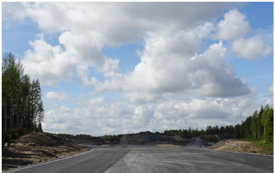
Kuva 2. Soramäen eritasoliittymä idästä katsottuna