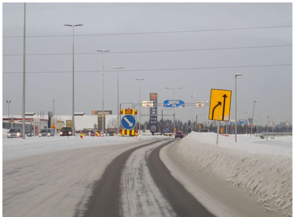
Kuva 6. Aukeankadun työnaikainen kiertoliittymä