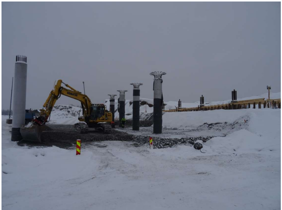
Kuva 2. Soramäen risteyssillan pilareita