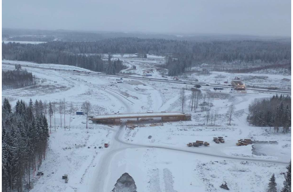
Kuva 4. Kujalan eritasoliittymä lännestä, etualalla Huovilanmäen risteysilta