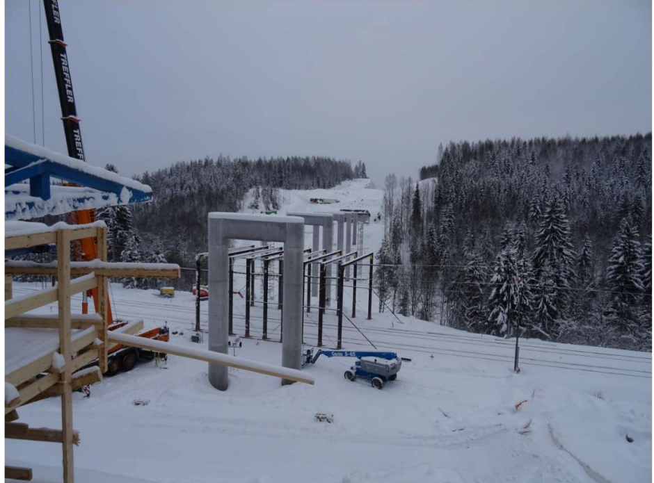
Kuva 1. Vähäjoen risteyssillan tukirakenteet valmiina ja radan suojakehikko rakenteilla