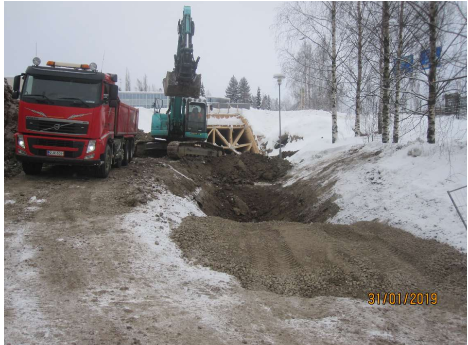
Kuva 5. Hulevesiviemärin kaivutöitä Kyöstilän alikulkukäytävän luona