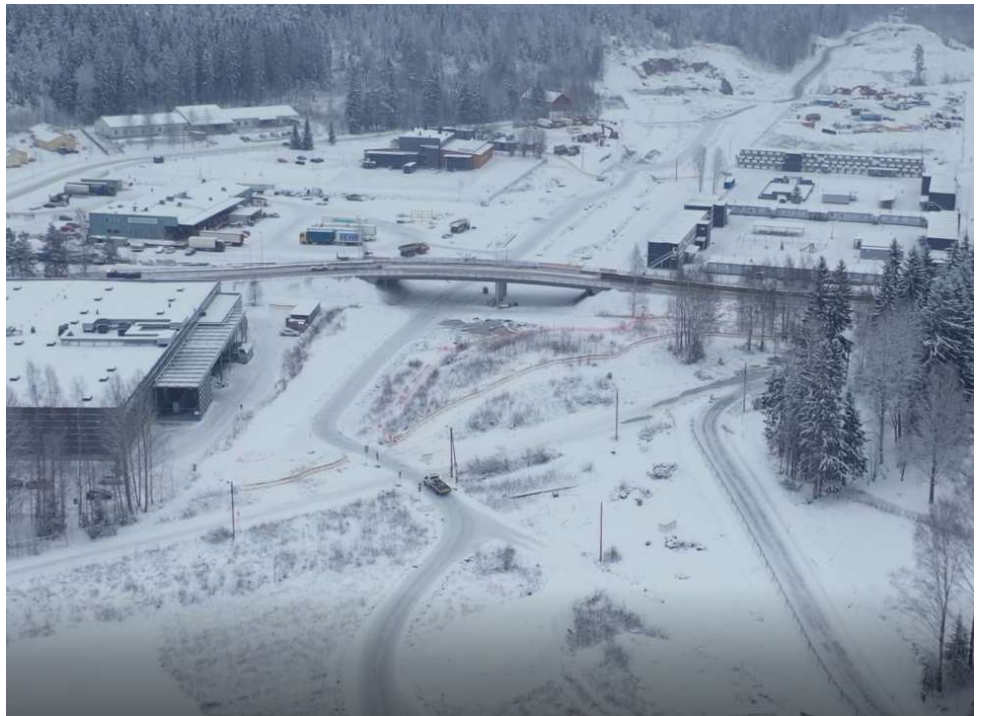
Kuva 3. Ajokadun risteyssilta päivää ennen avaamista liikenteelle

Sillanrakennustöitä tehtiin usealla sillalla: Kujalassa Lotilan risteyssillan valu odottaa kevättä, Kujalan risteyssillan paalutukset on saatu valmiiksi ja nyt rakennetaan maa- ja välitukia. Porvoonjoen ylittävillä Ali-Juhakkalan silloilla raudoitettiin paaluja. Lahti-Loviisa -radan alittavan Pipon alikulkusillan paalutukset saatiin valmiiksi.