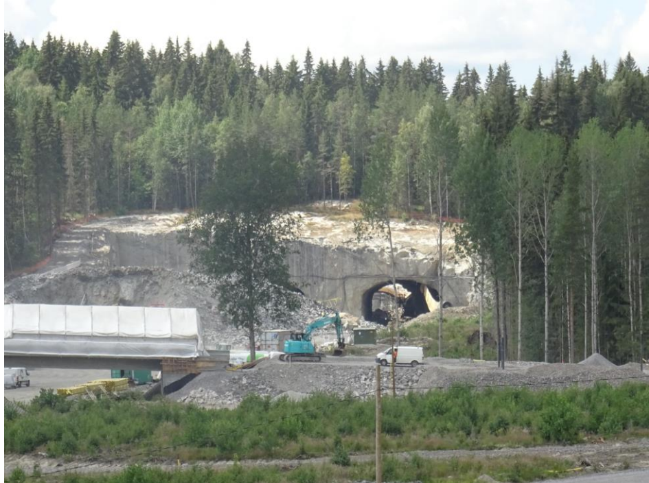
Kuva 4. Liipolan tunnelin itäinen suuaukko, oikeanpuolinen T-tunneli puhkaistu välitunnelille.