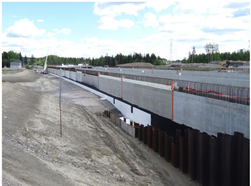
Kuva 3. Patomäen betonitunneli

Nikulan eritasoliittymässä tehtiin maaleikkaus-, louherakenne- ja kuivatus- töitä sekä rakennettiin mm. meluvallia. Kujalan eritasoliittymässä tehtiin viimeistelytöitä.