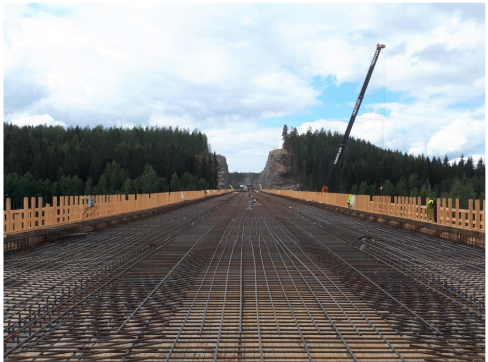
Kuva 2. Luhdanjoen ylikulkusillan kannen raudoitusta, taustalla Patiokallio