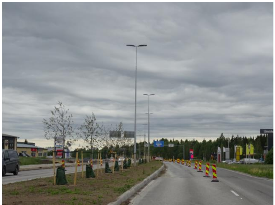
Kuva 6. Katupuita Uudenmaankadulla