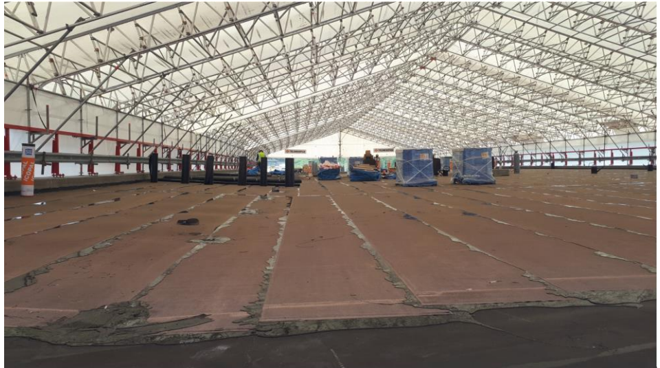
Kuva 1. Soramäen risteyssillan vesieristystä sääsuojassa