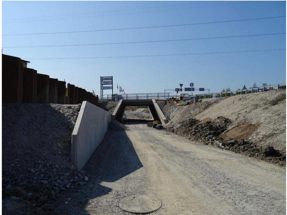
Kuva 5. Tuleva Nikkilän alikulkukäytävä Aukeankadun risteyksen pohjoispuolella