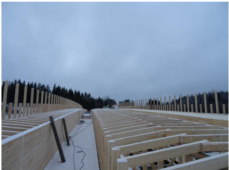
Kuva 2. Muotin rakentaminen käynnissä Tikkakallion risteysillalla