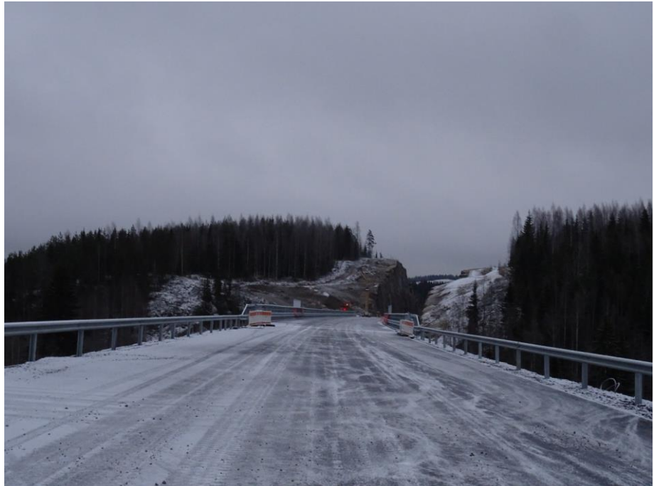
Kuva 1. Vähäjoen silta ja Patiokallio lännestä