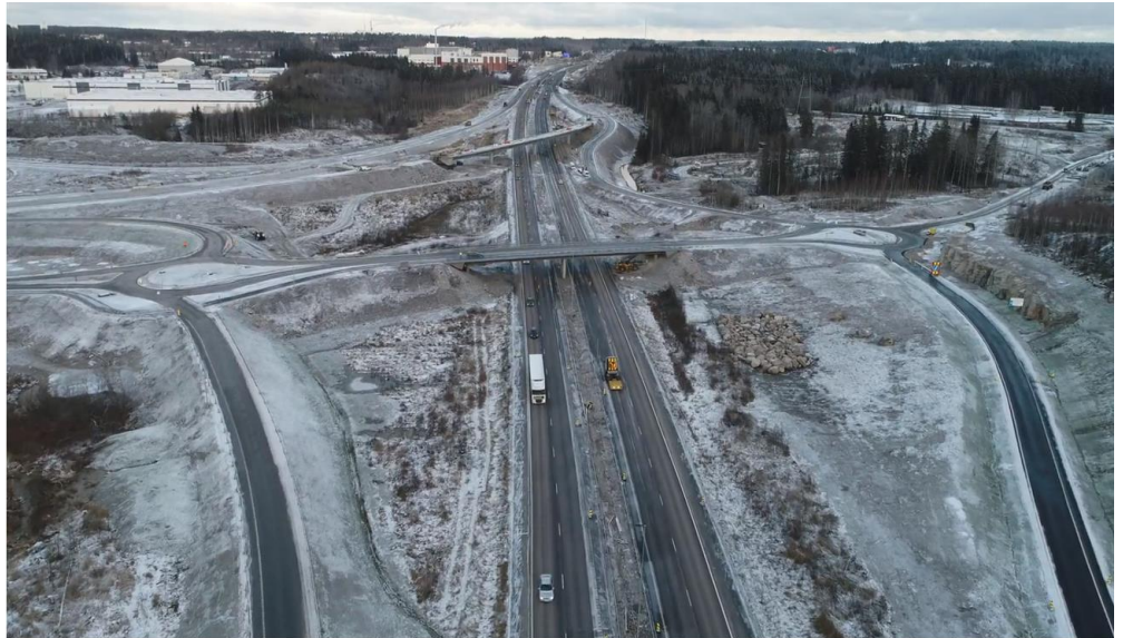
Kuva 4. Kujalan eritasoliittymä etelästä päin, ennen liikenteelle ottoa.