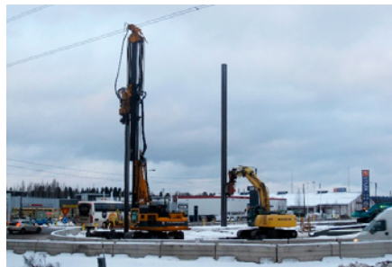
Kuvassa rakennetaan Nikkilän alikulkusillan tukiseinää Aukeankadun kulmassa.