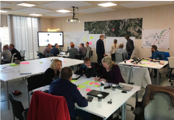
Liikenteenhallinnan työpajassa käytiin vilkasta keskustelua.

Tällä viikolla vietiin eteenpäin Liipolan tunnelin rakenneratkaisua. Työtunneleiden eri vaihtoehtoja on tarkasteltu ja päätetty toteutusvaihtoehdot. Patomäen betonitunnelin osalta on selvitetty suunnitteluperiaatteet. Teknisten järjestelmien pienryhmät ovat kokoontuneet ja jatkaneet suunnittelua. Keskiviikkona järjestettiin liikenteenhallinnan työpaja ja vietettiin VALTARIN pikkujouluja.