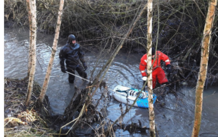
Paskurinojan uoman luotaus.

Tällä viikolla on pidetty eri asian- tuntijaryhmien kokouksia ja työpajoja, kuten mm. Patomäki-työpaja ja maisemasuunnittelun työpaja. Pohja- vesien koepumppaus on jatkunut Patomäessä. Luode Consulting Oy on käynyt luotaamassa Paskurinojan ja Porvoonjoen uomat. Kujalassa on jatkettu koepengerten rakentamista.