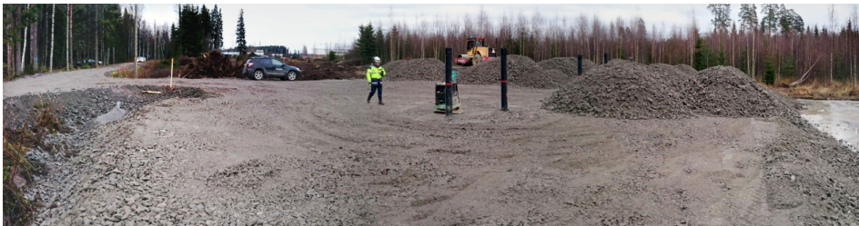
Kujalan koerakenne 1.