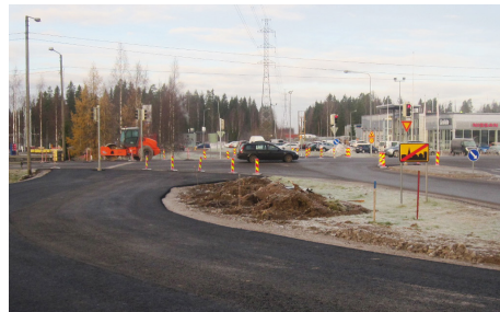
Aukeankadun kiertotie päällystetty.