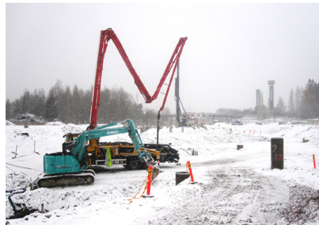
Ensilumi saavutti työmaan.