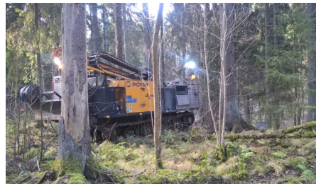
GM200 raskas porakone Porvoonjoen lähimaastossa.