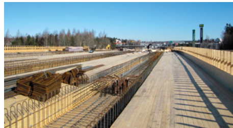
Launeen risteyssillalla raudoitustyöt etenevät hienosti aurinkoisessa kevätsäässä.