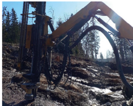
Tutkimustunnelin poraustyöt käynnissä Liipolassa.