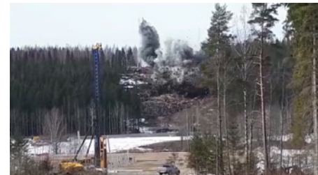
Ensimmäinen räjäytys Patiokalliolla.