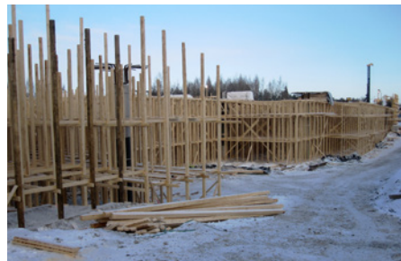
Launeen risteyssillan telinetyöt vauhdissa kirpeässä pakkassäässä.