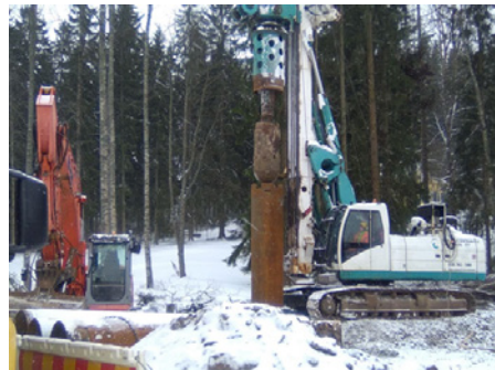
Kuvassa on paalukone siiviläkaivojen teossa.