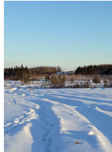
Työmaalle johtavat kairavaunujen, kaivinkoneen ja jalkamiesten jäljet aurinkoisen talvipäivänä. Tielinjalta on poistettu puusto.

Rakennustyöt ovat käynnissä Hollolan päässä, eivätkä pakkaslukemat ole hidastaneet rakentamista. Tällä viikolla on tehty kulkureittejä haastaviin kohteisiin. Ensimmäiset kulkuväylät syntyvät nyt helposti, kun ensin tiivistetään lumikerrosta ja annetaan sen sitten jäätyä. Tällä tavoin valmistellaan ensi viikolla koepaalutuspaikkoja Okeroisten alueella. Viikon aikana on lisäksi tutkittu Luhdanjoen ylikulkusillan maatuon paikkoja.