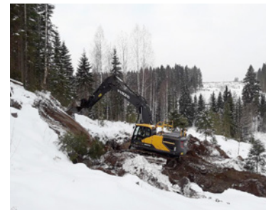
Kaivinkone selvittää kalliopinnan sijaintia Vähäjoen ylikulkusillan maatuen kohdalla.