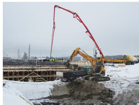
Hankaankadun risteyssillan valu sujui mallikkaasti.