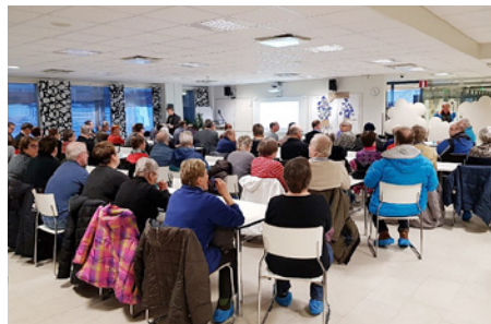
Tuleviin Liipolan ja Patomäen tunneleihin liittyvät asiat kiinnostivat yleisä kovasti Lahden asukastilaisuudessa.