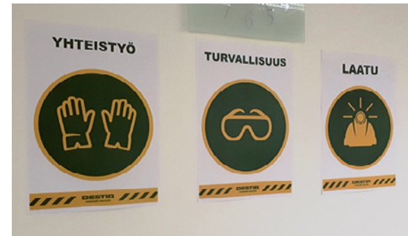
ST Kick Off -tilaisuudessa päätimme rakentaa Vt12 Letke -hanketta hyvässä yhteistyössä, turvallisuuuutta noudattaen ja laadukkaasti.

Viikolla rakennussuunnittelu, työnsuunnittelu ja massamäärien tarkastelut jatkuivat. Lisäpohjatutkimukset maastossa ovat loppusuoralla ja niitä jatketaan vielä ensi viikolla. Urakan ST-roumeissa on jälleen syntynyt aihioita ja ideoita suunnitteluratkaisuihin ja työn toteutukseen.