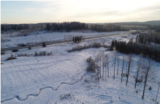
Talvista maisemaa Kujalasta.

Tällä viikolla pidettiin Hankeosien 1A ja 1B yhteensovituspäätös. Tekniikkaryhmistä viikolla kokoontuivat muun muassa geo-, maisema- ja väyläryhmät sekä liikenteen hallinnan ryhmä. Tunneleiden osalta tarkennettiin rakentamisen aikataulua ja laskettiin rakennuskustannuksia. Lahden kaupungin kanssa suunniteltiin hankintamarkkinoiden järjestämistä. Pohjatutkimuksia tehtiin muun muassa valtatie 4 varressa ja Pippon moottoriturheiluradalla sekä Liipolassa.