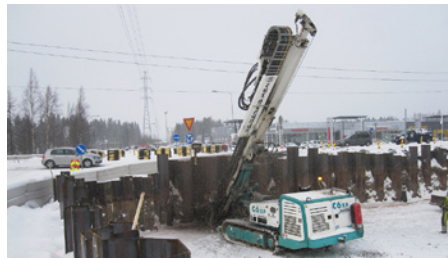
Kuvassa asennetaan Nikkilän alikulkukäytävän tukiseinän ankkureita Aukeankadulla.