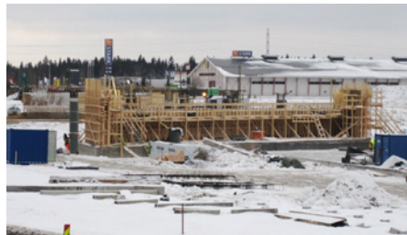
Launeen tulevan risteyssillan rakentaminen jatkuu talvenkin aikana.