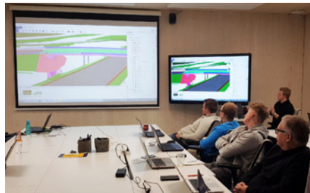
Trimble connect -ohjelman ohjeistusta Big Roomissa.