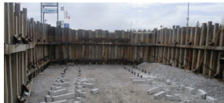
Tärkeä etappi saavutettiin Nikkilän alikulkukäytävällä, kun paalutukset valmistuivat.