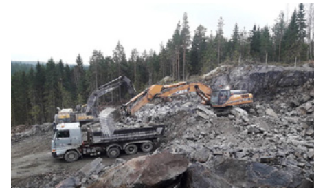
Kuvassa louheen kuormausta Patiokalliolla.