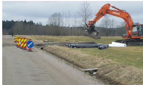
Patomäen kentällä rakennettiin työmaatietä.