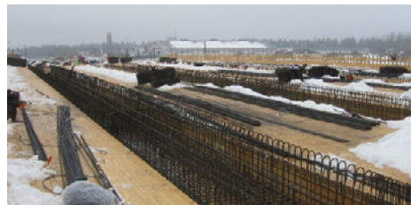
Launeen risteyssillalla kannen muotti- ja raudoitustyöt ovat hyvässä vauhdissa.