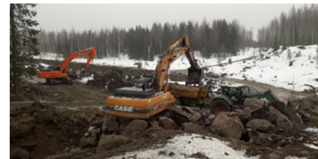
Patiokallio louhinnan jälkeen.