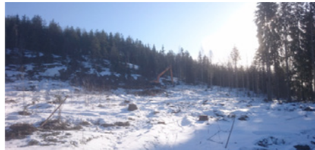
Kaivinkone töissä tulevan Liipolan tunnelin läntisen suuaukon edustalla.