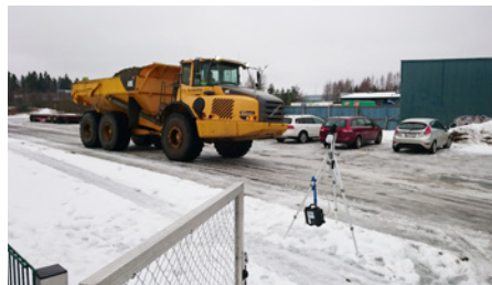
Kuvassa tehdään melu- ja tärinämittausta Launeen koulun läheisyydessä.