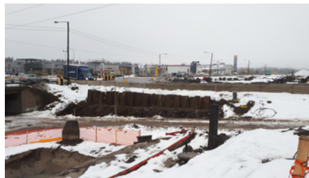
Nikkilän alikulkukäytävän tukiseinä valmistui.