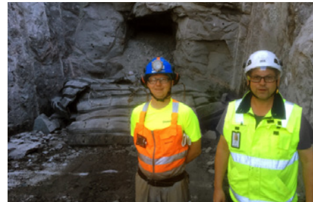
Kuva ensimmäisen tutkimustunnelin tulevalta suuaukolta.