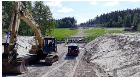
Kuvassa on aloitettu työsillan rakentaminen Luhdanjoen yli. Varsinainen Luhdanjoensilta ulottuu kaukana vastapuolella näkyvien paalujen luokse.