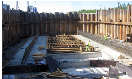
Nikkilän alikulkukäytävän peruslaatat Aukeankadun kohdalla valettiin 23.5.