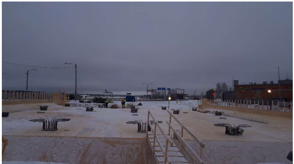
Kuva 2. Sillan S1 muotti