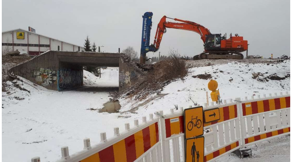
Kuva 1. S36 kiertotie käytössä