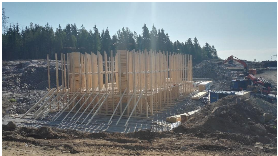
Kuva 1. Kirkkotien ylittävän sillan S1 siltatelineiden pystytys on käynnissä.

Vanhan Hämeenlinnantien (Mt 130) ja Kirkkotien ylittävillä silloilla S4 ja S1 on käynnissä kannen telineiden rakentamistyöt. Kirkkotien ylittävän sillan S1 pilarit on valettu heinäkuun aikana.