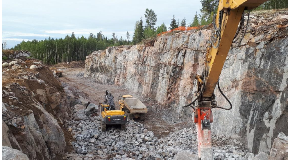
Kuva 4. Louheen kuormaus ja rammerointi on käynnissä valtatie 3 ympäristössä.

Heinäkuun aikana valtatie 3 välikaistat on asfaltoitu.