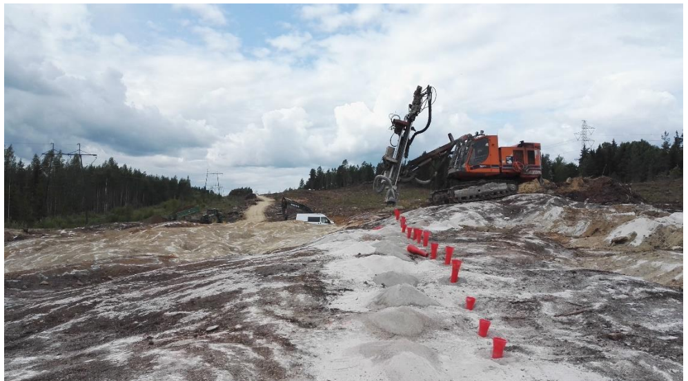
Kuva 3. Kirkkotien alueen louhintatyöt on käynnissä.

Louhintatyöt ja työmaateiden teko jatkuu edelleen urakka-alueella. Louhintatöiden vuoksi valtatien 3 sekä maantien 130 liikenne joudutaan katkaisemaan räjäytysten ajaksi, pysäytys kestää enintään 8 minuuttia. Myös Kirkkotien louhintatyöt ovat jatkuneet urakka-alueella.