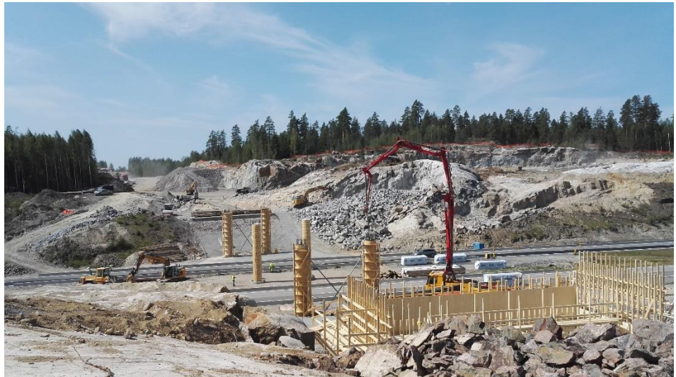
Kuva 2. Valtatien 3 ylittävän sillan S5 pilareiden valu on käynnissä.

Valtatien 3 ylittävän sillan S5 anturat, peruslaatat ja pilareita sekä Luhtajoen risteyssillalla S2 porapaalut on valettu heinäkuun aikana. Sillalla S5 on käynnissä osan pilareiden maatuen täyttö.