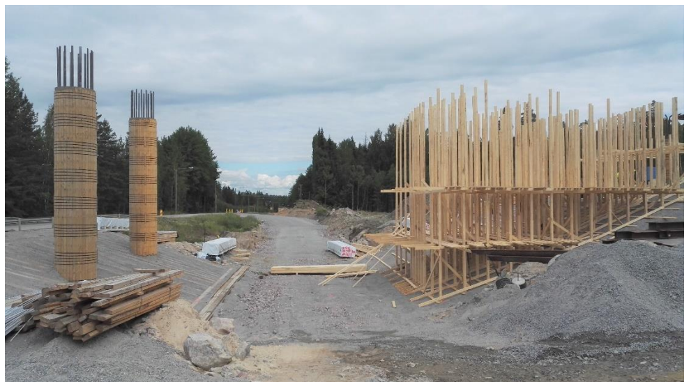
Kuva 1. Vanhan Hämeenlinnantien ylittävän sillan S4 työmaa-alue.

Metsäkyläntien sekä vanhan Hämeenlinnantien (Mt 130) ylittävillä silloilla S3 ja S4 on käynnissä kannen telineiden rakentamistyöt.