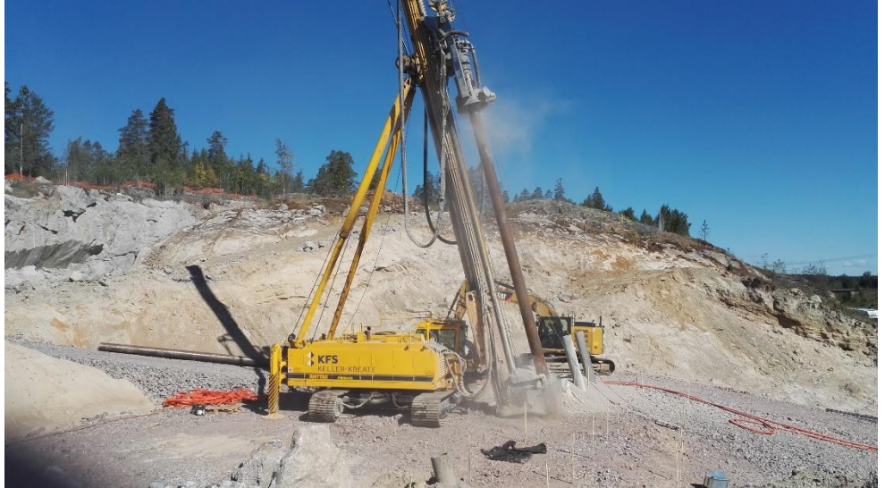
Kuva 2. Kuvanotto hetkellä porapaalutustyöt käynnissä valtatie 3 länsipuolella, 24.6.2019.

Valtatien 3 ylittävän sillan S5 porapaalutustyöt ovat valmistuneet kesäkuun aikana.