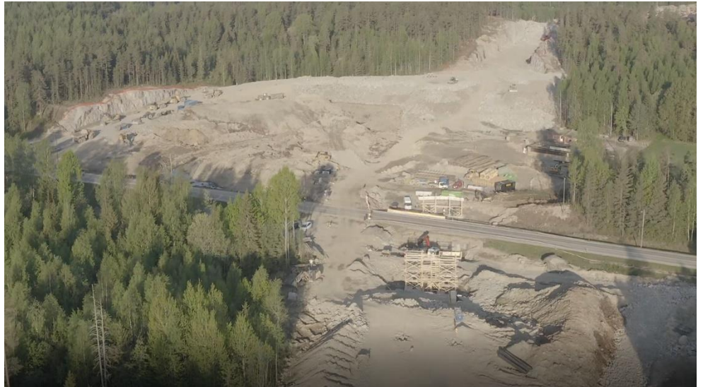
Kuva 4: Hämeenlinnantien (Mt 130) varrella oleva työmaa-alue.

Hämeenlinnantien ylittävän sillan peruslaatat ja sillan pilarit on valettu. Kyseisellä siltapaikalla on välitukimuottien ja raudotteiden asennustyöt käynnissä.