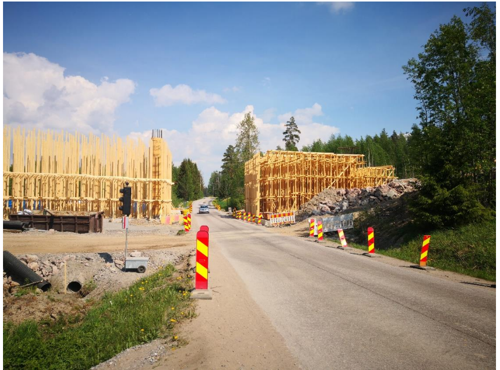
Kuva 3: Metsäkyläntien ylittävä silta.

Metsäkyläntien ylittävän sillan kannen telineiden rakentamistyöt ovat käynnissä.