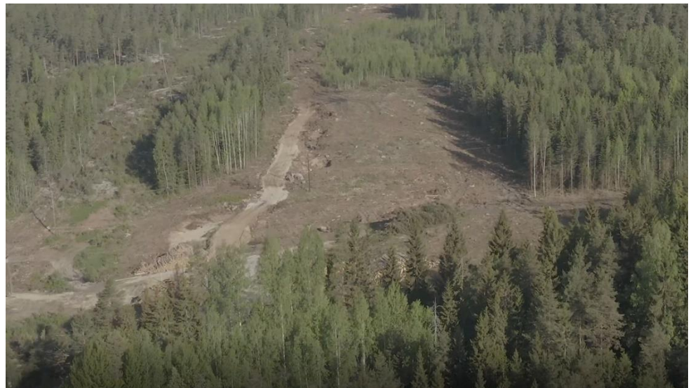
Kuva 2: Kirkkotien tiealueen työmaa-aluetta.

Työmaan turvallisuustasoa mittaavien MVR-mittausten keskiarvo toukokuulta on 96,5 %.