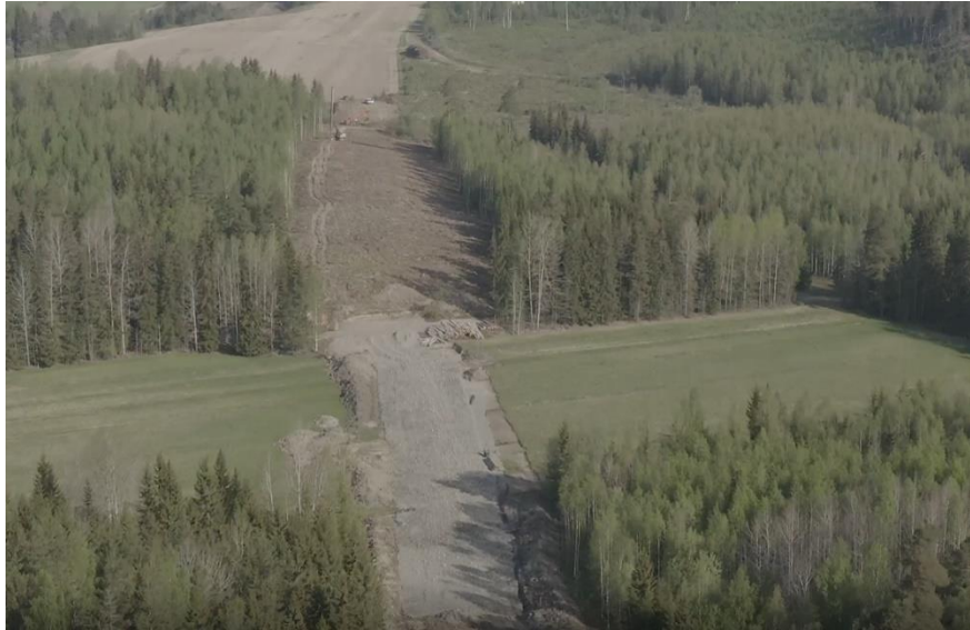
Kuva 5: Pystysalaojitustyöt käynnissä.

Pystysalaojitustyö jatkuu Tulvatien ja Aittakalliontien välisellä alueella.