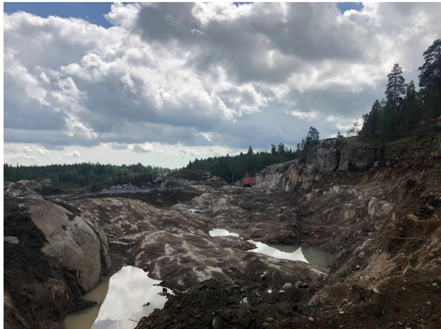
Kuva 6: Valtatie 3 reuna-alueiden louhintatyöt ovat käynnissä. Kuvassa osittain jo puhdistettua kalliopintaa.

Louhintatyöt ja työmaateiden teko jatkuu edelleen urakka-alueella. Louhintatöiden vuoksi valtatie 3 sekä maantien 130 liikenne joudutaan katkaisemaan räjäytyksien ajaksi, pysäytys kestää enintään 8 minuuttia.