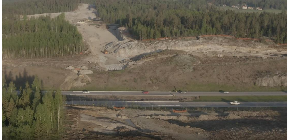
Kuva 1: Valtatien 3 työmaa-alue.

Toukokuun aikana hankkeella on suoritettu ilmakuvauus.