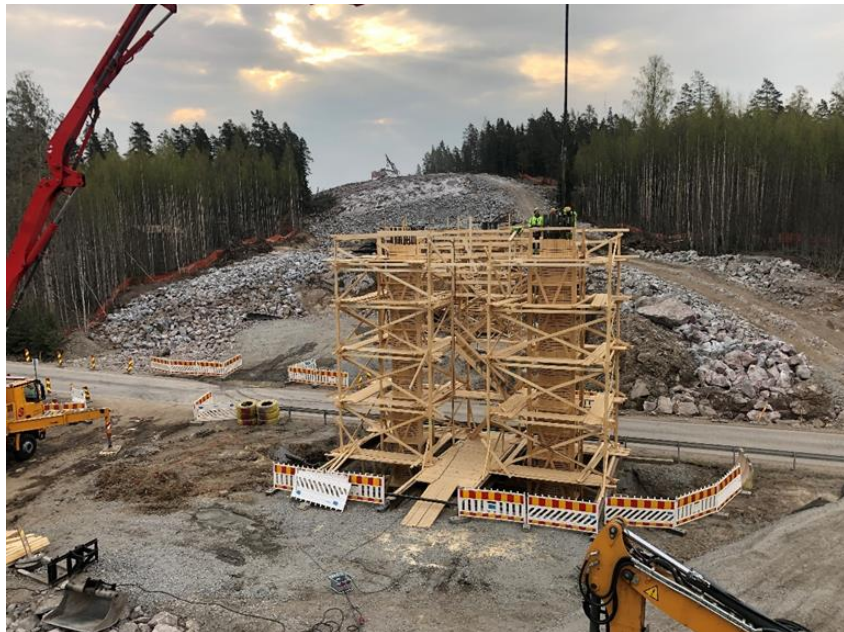
Kuva 1. Sillan pilareiden valu käynnissä.

Metsäkyläntien ylittävän sillan pilarimuottityöt on saatu valmiiksi. Sillan pilarit on valettu 26.4.2019.