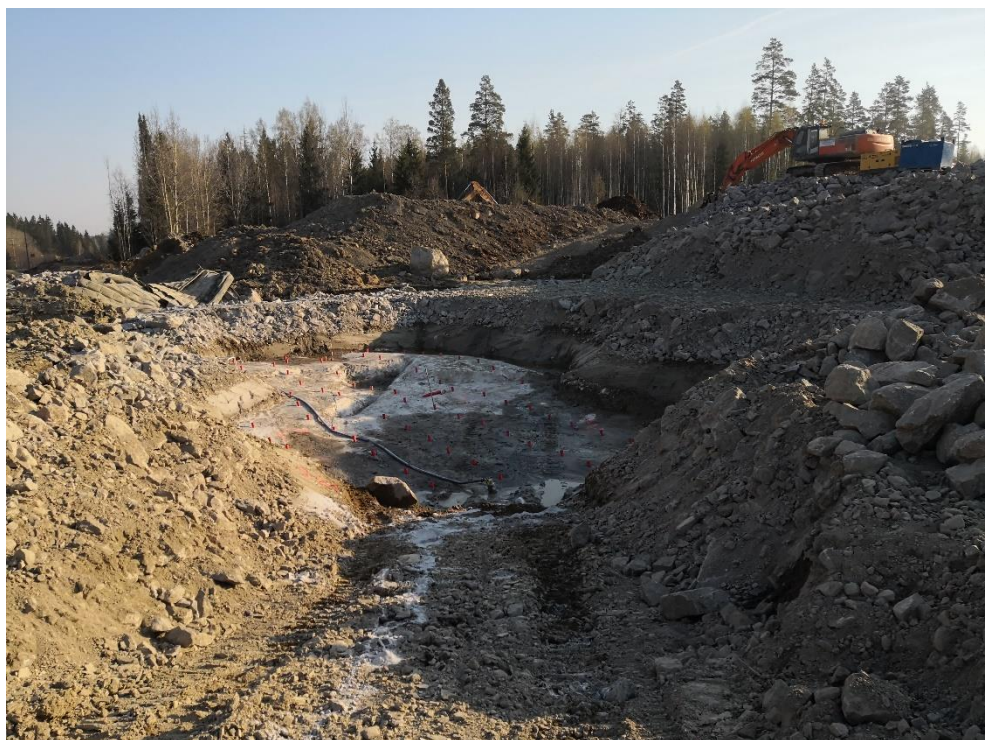
Kuva 2. Louhinta- ja maanrakennustyöt käynnissä.

Pystysalaojitustyöt käynnissä Tulvatien ja Aittakalliontien välisellä alueella.