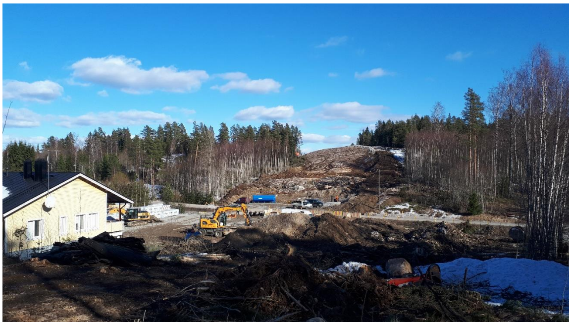
Kuva 2. Työmaa-alue Metsäkyläntieltä itään päin kuvattuna.

Vt 3 Liikenteenhallintajärjestelmä Klaukkala - Nurmijärvi rakennussuunnittelun kilpailutus on käynnissä.