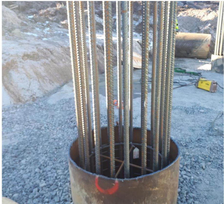
Kuva 1. Sillan porapaalu raudoitettuna ja valmiina valuun.

Metsäkyläntien ylittävän sillan porapaalu työt on saatu valmiiksi. Porapaalut on valettu 27.3.2019.