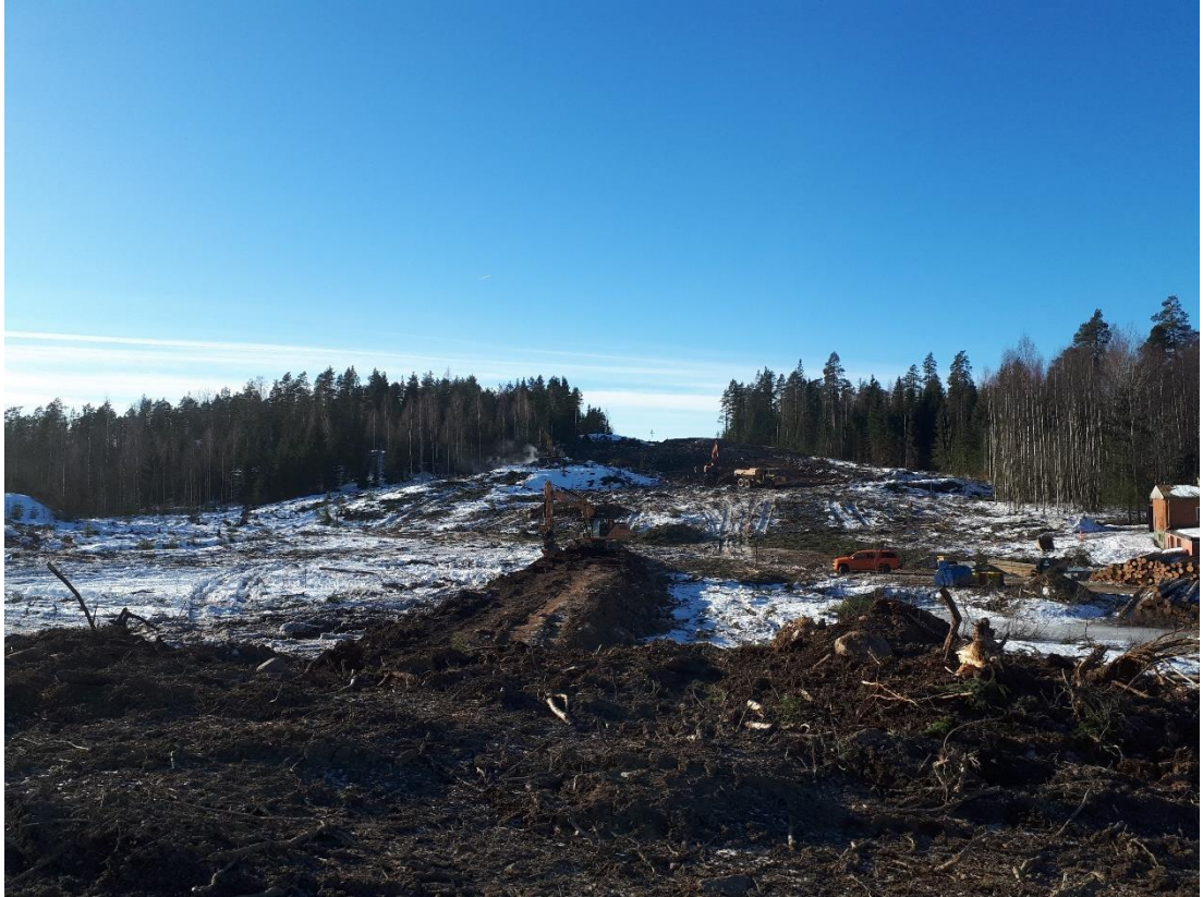
Kuva 2. Työmaa-alue Hämeenlinnantien varrelta.

Hankkeessa ei ole sattunut tapaturmia helmikuussa 2019.