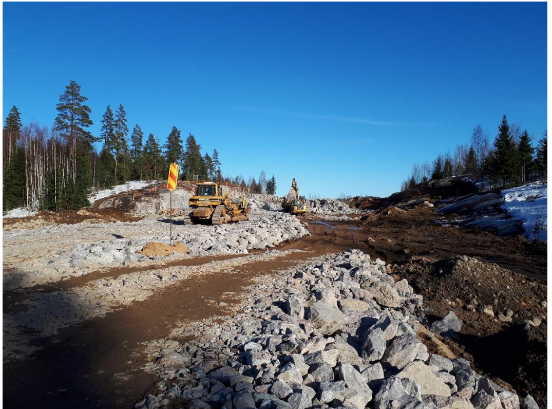
Kuva 1. Louhepenkan teko käynnissä.

Louhintatyöt sekä työmaateiden teko ovat käynnistyneet helmikuun aikana. Louhintatöiden vuoksi maantien 130 liikenne joudutaan katkaisemaan räjäytyksien ajaksi, pysäytys kestää enintään 8 minuuttia.