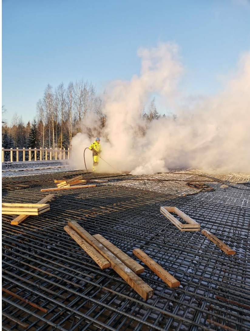
Kuva 1. Kannen valutyöt on alkamassa Luhtajoen risteyssillalla.

Valtatien 3 (Vt 3) ylittävän sillan S5 kannen jännitystötä on tehty joulukuun aikana.