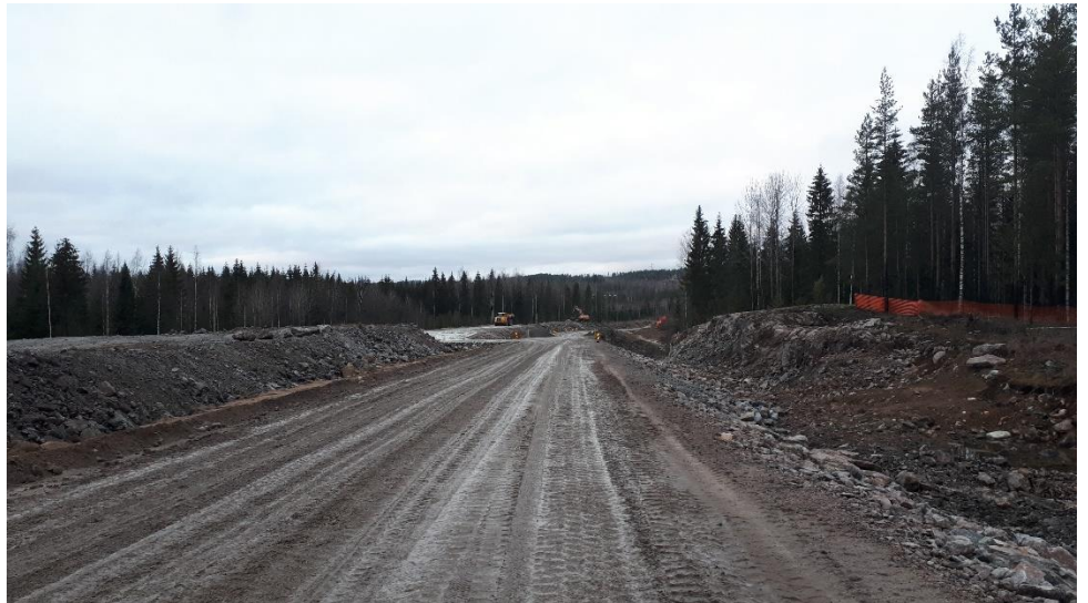
Kuva 3. Penger- ja kiilaustöitä on tehty mm. Luhtajoen ja Kirkkotien välisellä alueella.

Vesihuolto- ja maanleikkaustyöt, pengertyöt sekä louhepenkereiden kiilaustyöt ovat jatkuneet joulukuun aikana urakka-alueella.