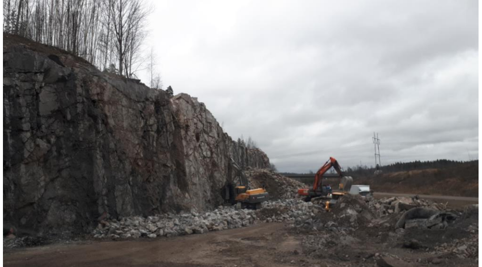
Kuva 2. Vt 3 tulevien ramppien louhinta on käynnissä.

ajaksi, pysäytys kestää enintään 8 minuuttia. Louhintatöitä on tehty lisäksi Kirkkotien alueella.