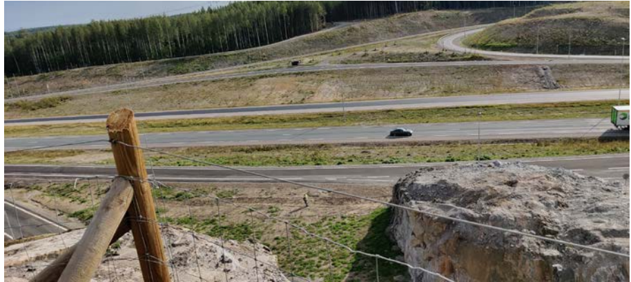
Kuva 1. Nurmikon kylväminen käynnissä Vt3:n rampeilla. Kuva 12.8.2021