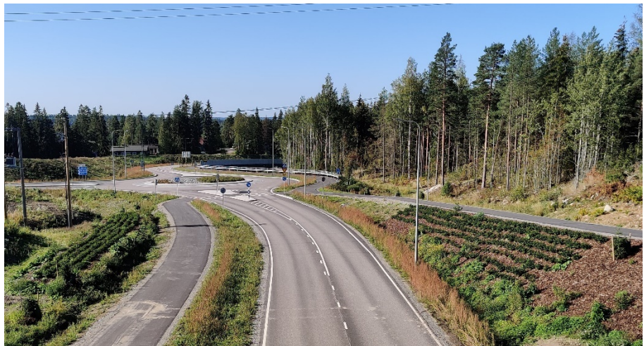
Kuva 2. Kirkkotien ja Kehätien risteysalueen istutustyöt valmiit. Kuva 30.8.2021