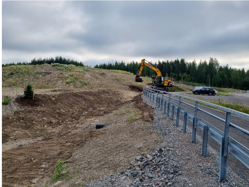
Kuva 1. Lamminsuon eritasoliittymän alueen itäpään (pohjoispuoli) luiskan muotoilut käynnissä. Kuva 7.7.2021