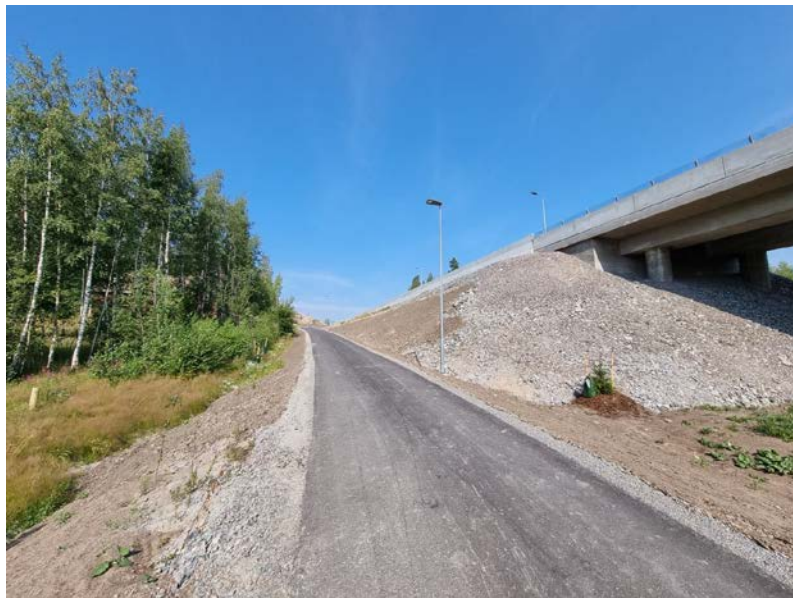
Kuva 2. S3 etelä/länsipuolen luiska viimeistely ja kasvualusta lisätty. Kuva 15.7.2021