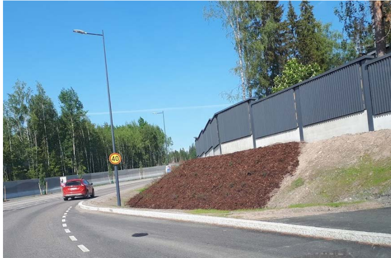
Kuva 1. Kirkkotien luiskassa kuorikate asennettu istutuksien juureen, kuva 8.6.2021