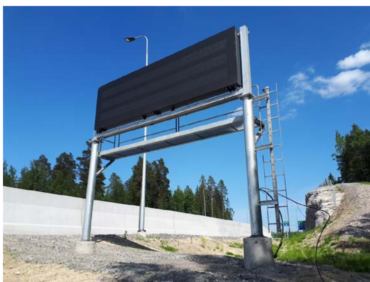
Kuva 3. Kehätien opaste asennettu, kuva 8.6.2021.

Portaalien asennus ja kaapelointityöt on tehty. Opasteet, vaihtuvat nopeusrajoitusmerkit (peitettynä) ja kameramastot on asennettu paikoilleen. Urakkaan liittyvät maarakennustyöt ovat valmistuneet pääosin kesäkuun aikana.