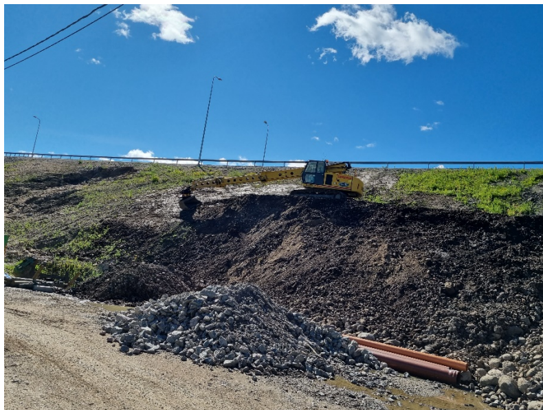
Kuva 2. Luiskan levitys ja muotoilu käynnissä n. pl. 7000, kuva 15.6.2021