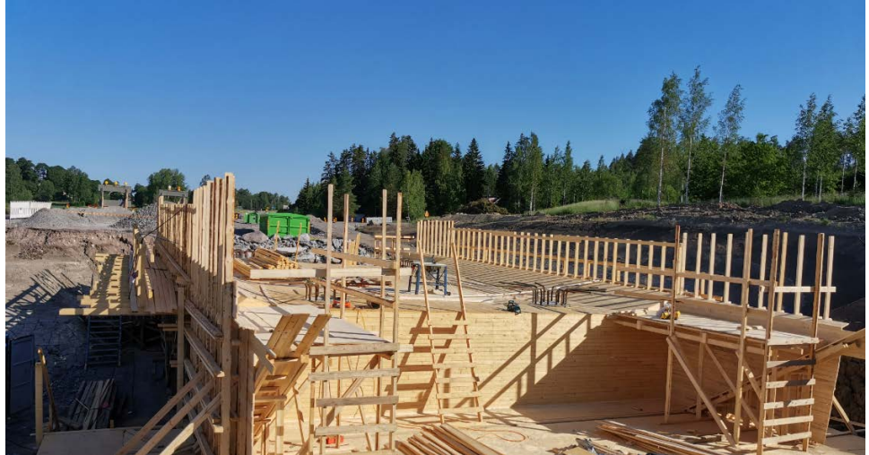
Kuva 1. S104 muottityöt pääosin valmiit. 25.6.2020