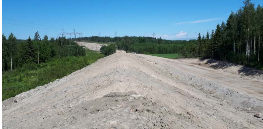
Kuva 3. Meluvalli paalulla 4600 Kirkkotielle päin 17.6.2020