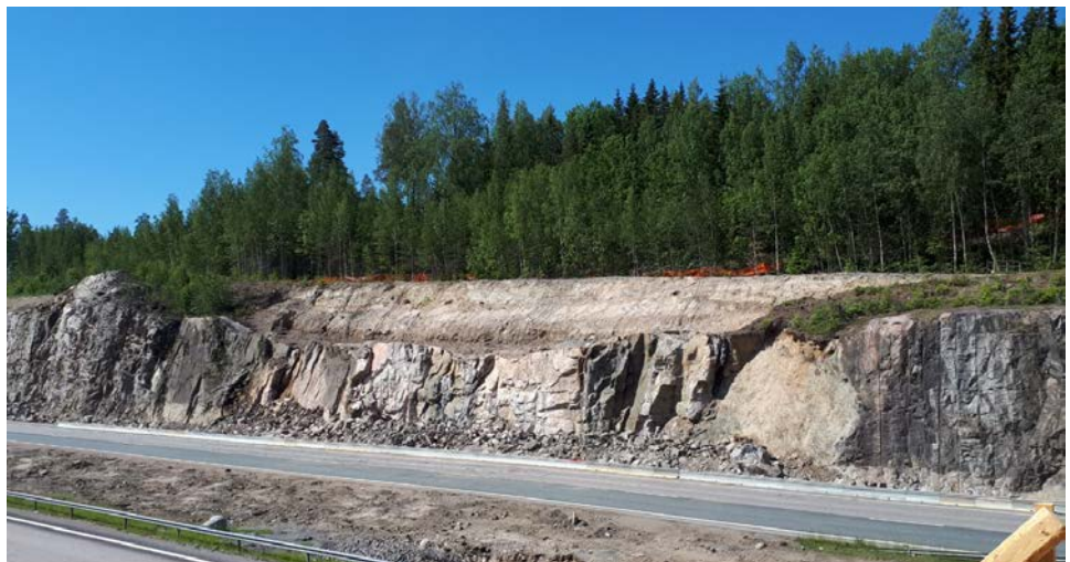
Kuva 2. Vt 3 rampin E5R3 kallioseinämä yö louhinnan jälkeen 17.6.2020

Louhintatyöt päivä- ja ilta-aikaan ovat jatkuneet Vt 3:n läheisyydessä. Näiden louhintatöiden vuoksi Vt 3 liikenne on jouduttu ajoittain katkaisemaan räjäytyksien ajaksi, pysäytyksen kesto enintään 8 minuuttia. Vt3 läheisyyden louhintatyöt ovat pääosin valmiit.