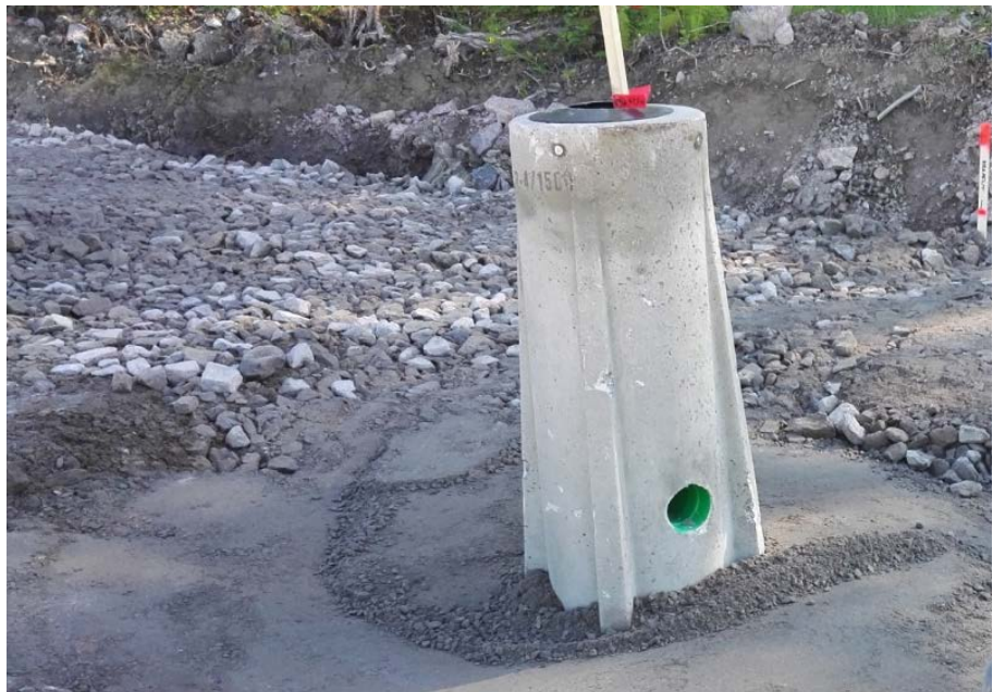
Kuva 4. Kirkkotien ja Havumäentien risteuksen valaistuksen asennus 10.6.2020