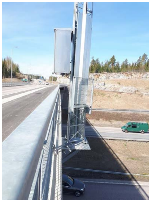
Kuva 4. Kameramastojen asennus käynnissä, kuva 11.5.2021