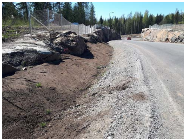
Kuva 2. Multauksia tehty Kirkkotien alueella, kuva 12.5.2021