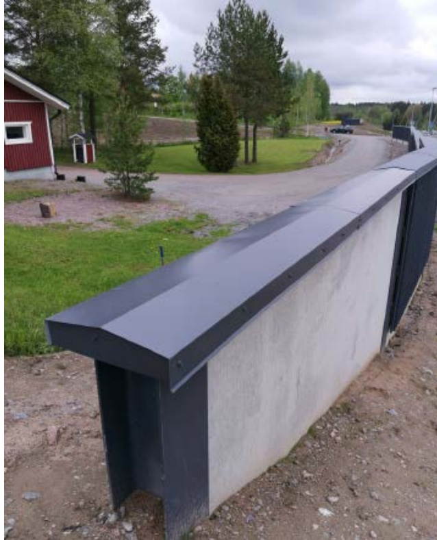
Kuva 1. Meluseinän Me1 hattupelti asennettu, kuva 27.5.2021