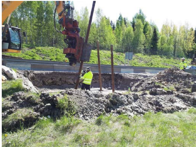
Kuva 3. Tiedotusopasteportaalin T1 perustusten paalutus käynnissä, kuva 24.5.2021.

Portaalijalustojen asennus ja kaapelointityöt ovat käynnissä sekä kameramastoja on asennettu. Urakkaan liittyvät maarakennustyöt ovat valmistumassa juhannukseen mennessä.