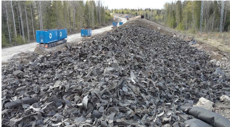
Kuva 3. Meluvallin rengasleikekevennys 18.5.2020

Maanleikkaustyöt, pengertyöt sekä louhepenkereiden kiilaustyöt ovat jatkuneet toukokuun aikana urakka-alueella. Maarakennustyöt ovat painottuneet toukokuussa Vt3 läheisyyteen, Kirkkotien alueelle sekä urakan länsipäähän Perttulassa. Yksityisteiden, telematiikan ja valaistuksen putkituksien rakentaminen on jatkunut toukokuussa.