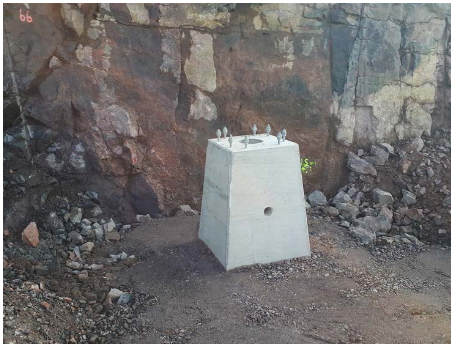
Kuva 4. Kirkkotien läheisyydessä liikenneportaalin jalusta asennettu 19.5.2020