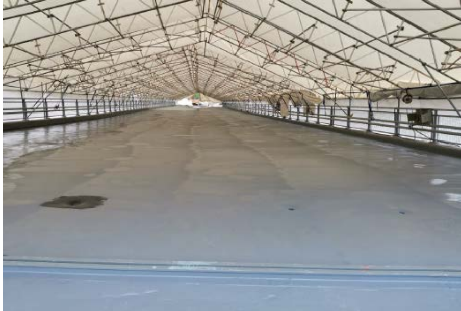
Kuva 1. S5 vedeneristystyöt työt käynnissä 28.5.2020