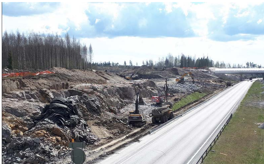
Kuva 2. Vt 3:n itäpuolella louhinta- ja maanleikkaustyöt käynnissä 5.5.2020

Louhintatyöt päivä- ja ilta-aikaan ovat jatkuneet Vt 3:n läheisyydessä. Näiden louhintatöiden vuoksi Vt 3 liikenne joudutaan ajoittain katkaisemaan räjäytyksien ajaksi, pysäytys kestää enintään 8 minuuttia.