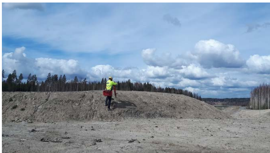
Kuva 2. Istutustyöt käynnissä, kuva 22.4.2021