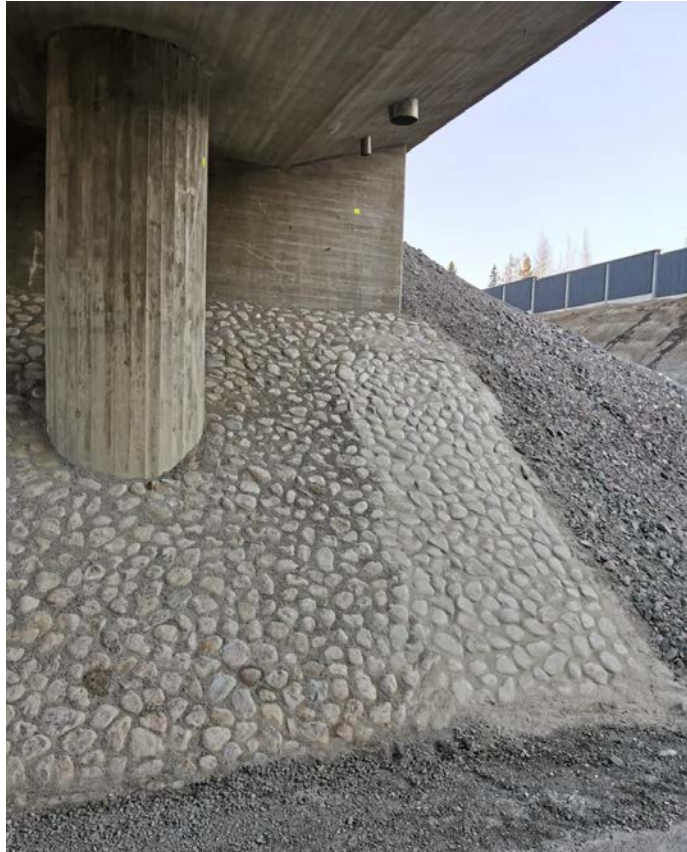
Kuva 1. S104 pintavesikaivon alapuoliset kiviverhoukset saumattu. kuva 21.4.2020