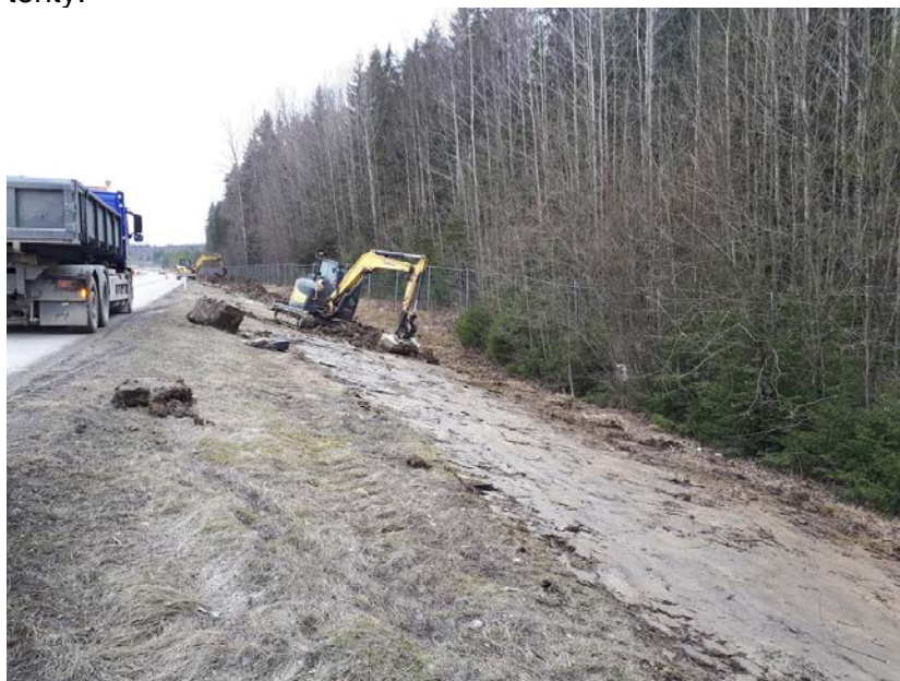
Kuva 3. Kaivanto on peitetty ja ojan muotoilu käynnissä, kuva 23.4.2021

Putkitustöitä on tehty Vt3:lla ja Mt130 varrella. Kaikki alitusporaukset on tehty.