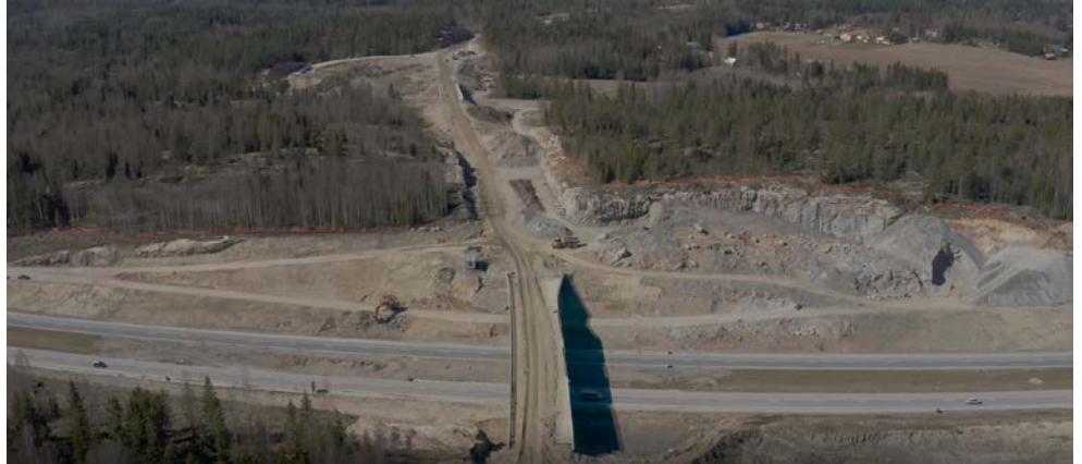
Kuva 1. Silta S5 ja Vt3:lle liittyvät rampit, ilmakuvaus 22.4.2020