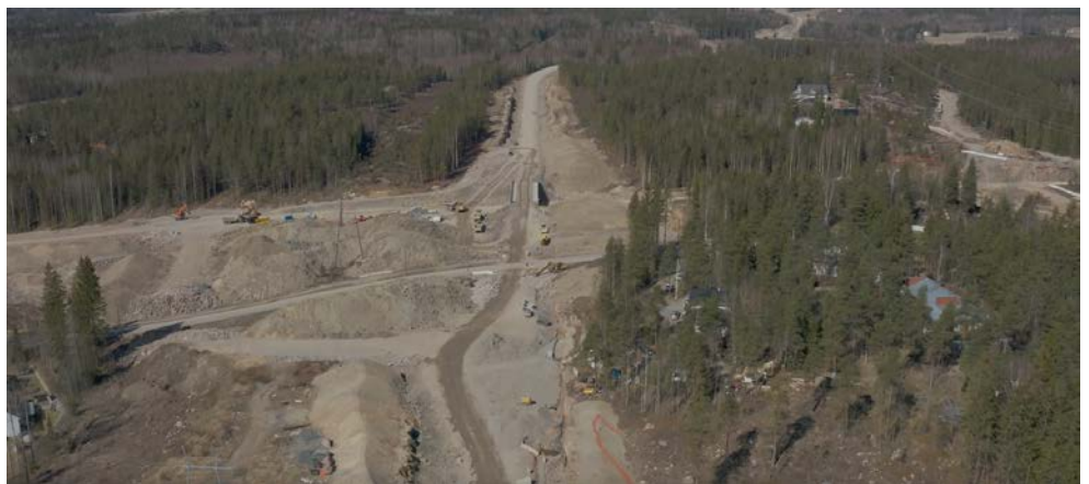
Kuva 2. Nykyisen Kirkkotien ja Mt 132 risteäminen, ilmakuvaus 22.4.2020

Louhintatyöt päivä- ja ilta-aikaan ovat jatkuneet Vt 3:n läheisyydessä. Näiden louhintatöiden vuoksi Vt 3 liikenne joudutaan ajoittain katkaisemaan räjäytyksien ajaksi, pysäytys kestää enintään 8 minuuttia.