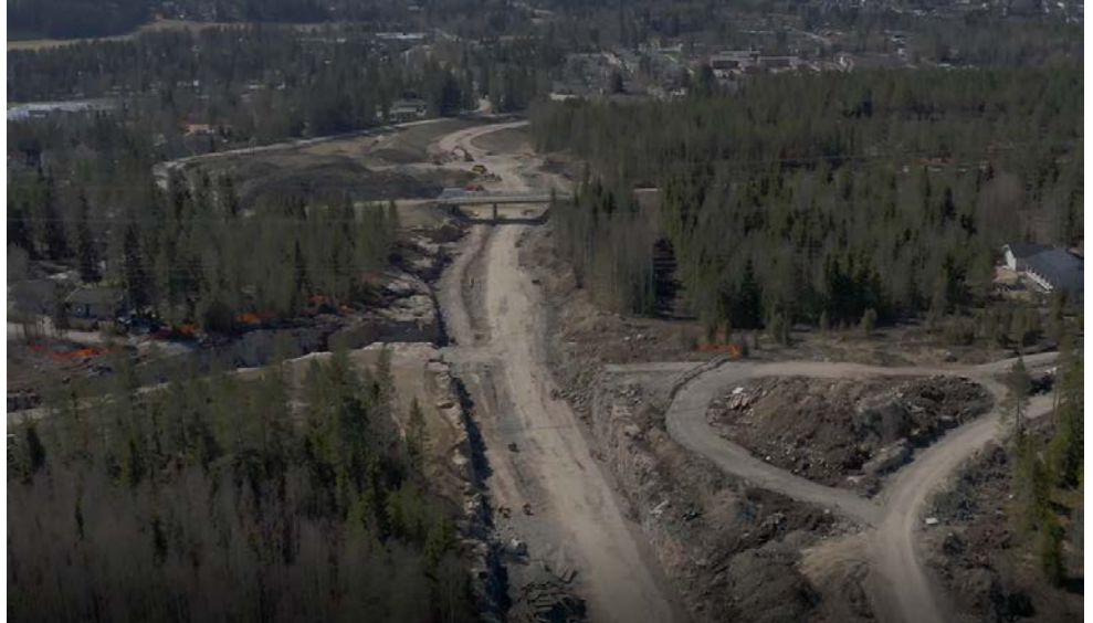
Kuva 3. Uutta Kirkkotien pohjaa etelään päin, ilmakuvaus 22.4.2020