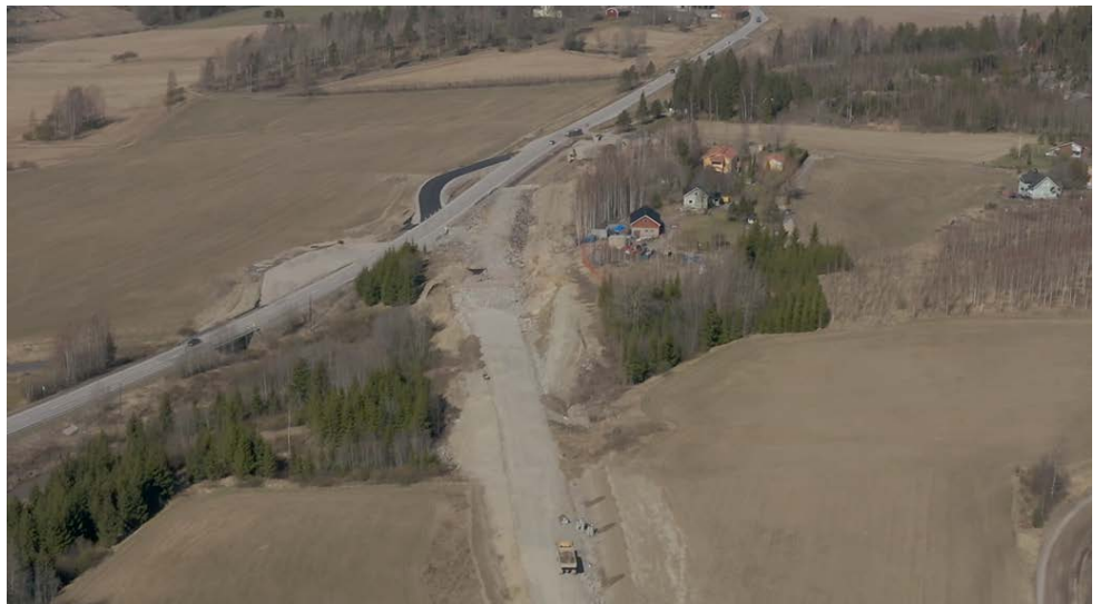
Kuva 4. Kiertotie sillan S104 rakentamista varten, ilmakuvaus 22.4.2020

Aittakalliontien kohdalla on kiertotie otettu liikenteen käyttöön 28.4.2020 Myös yksityisteiden rakentaminen on jatkunut huhtikuussa.