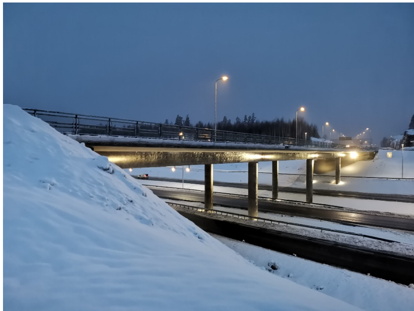
Kuva 1. S5 sillan erikoisvalaistus asennettu, kuva 27.1.2021

Kaikki sillat ovat pääosin valmiit. Siltojen viimeistelytyöt ovat käynnissä.