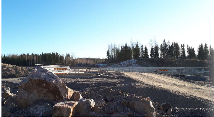
Kuva 1. Silta S5 työmaaliikenteen käytössä.