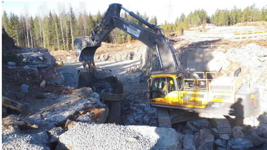
Kuva 2. Louheen kuormaus käynnissä.

Louhintatyöt päivä- ja ilta-aikaan ovat jatkuneet Vt 3:lla. Näiden louhintatöiden vuoksi Vt 3 liikenne joudutaan ajoittain katkaisemaan räjäytyksien ajaksi, pysäytys kestää enintään 8 minuuttia. Louhintatöitä on tehty lisäksi Havumäentieltä pohjoiseen Kirkkotien tienvieressä.