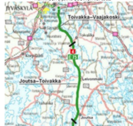
Hankkeen sijainti Suomen kartalla

Esiselvityksen mukainen kustannusarvio koko yhteysvälille Joutsa–Kanavuori on 330 M€ (MAKU 145; 2020=100).