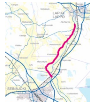
Hankkeen sijainti Suomen kartalla

Toteutuksen kustannusarvio on 10,5 M€ (MAKU-indeksi 145; 2020=100). Edellä mainitusta Ykskorvaasentien kiertoliittymän osuus on n. 1 M€.