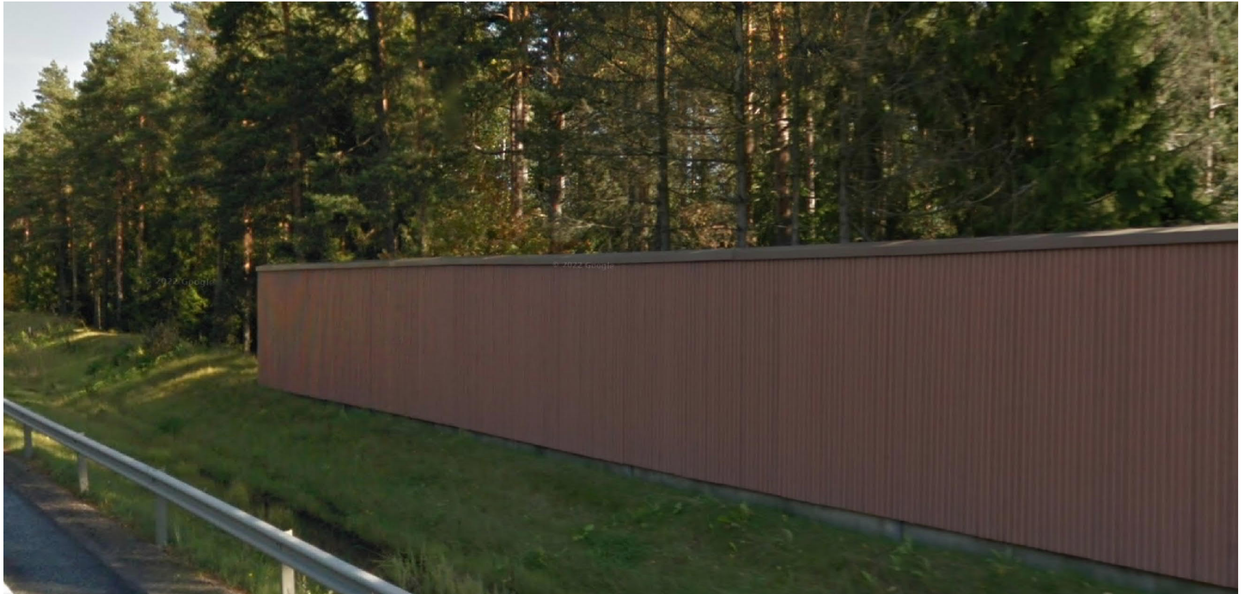
Nykyisen meluseinän jatkaminen, entisen ulkoasun mukaisena