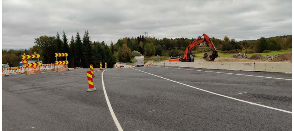
Kuva 1. S104 uusi kiertotie otettu käyttöön, kuva 22.9.2020