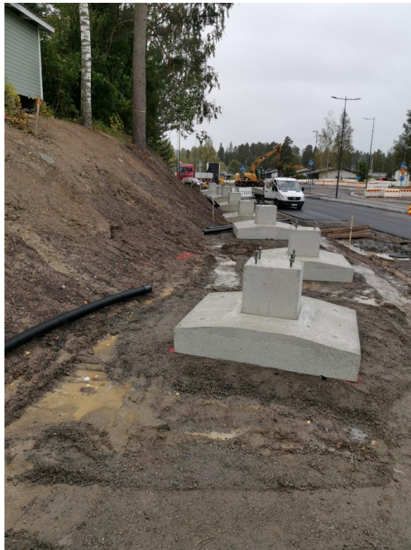
Kuva 4. Me 16 anturaelementit Kirkkotiellä, kuva 17.9.2020

Maarakennustyöt ovat olleet käynnissä syyskuussa koko urakka-alueella. Kiilaustyöt ovat pääosin valmistuneet syyskuun aikana. Kantavan kerroksen tekeminen ja päällystykset ovat olleet käynnissä uudella tielinjalla ja eritasoliittymien rampeilla. Yksityisteiden, meluaitojen, valaistuksen ja telematiikan putkituksien rakentaminen on jatkunut syyskuussa.