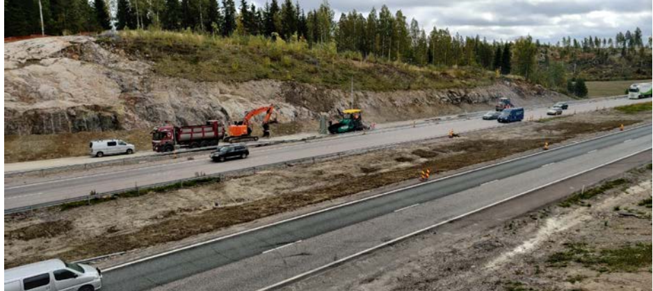
Kuva 3. Rampin E5R1 alimman päällystekerroksen levittäminen, kuva 22.9.2020

Maarakennustyöt ovat olleet käynnissä syyskuussa koko urakka-alueella. Kiilaustyöt ovat pääosin valmistuneet syyskuun aikana. Kantavan kerroksen tekeminen ja päällystykset ovat olleet käynnissä uudella tielinjalla ja eritasoliittymien rampeilla. Yksityisteiden, meluaitojen, valaistuksen ja telematiikan putkituksien rakentaminen on jatkunut syyskuussa.