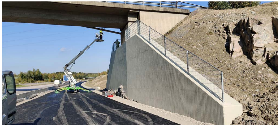
Kuva 2. S6 hulevesi kourujen asennus ja tukimuurin kaiteet asennettu, kuva 23.9.2020