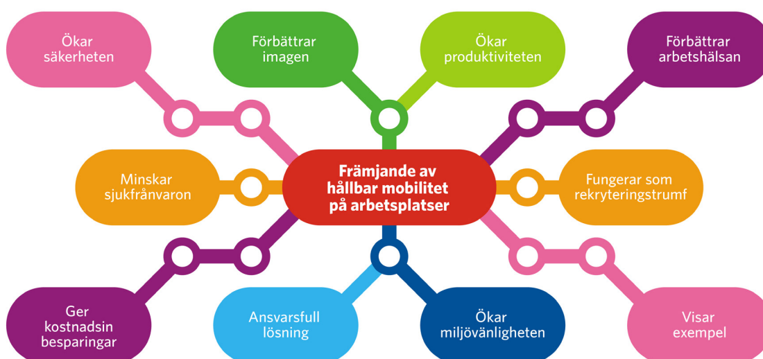
Bild 1 Arbetsplatsernas nytta av hållbar mobilitet

Syftet med mobilitetsstyrning på arbetsplatser är att påverka de anställdas val av färdssätt och uppmuntra och styra dem till att använda hållbara färdssätt. Samtidigt betonas arbetsplatsernas mångfaldiga nytta av hållbar mobilitet (bild 1). Mobilitetsstyrning på arbetsplatser förekommer redan i stor utsträckning i många europeiska länder och det finns ett stort utbud av metoder.