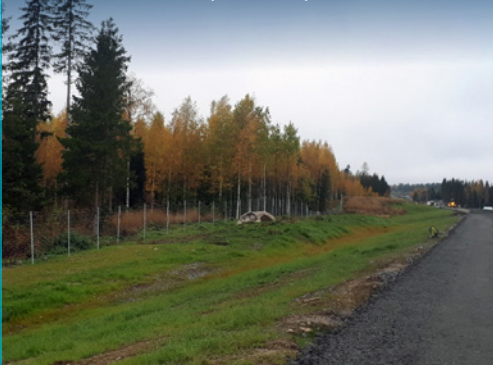
Riista-aidan asennustyöt ovat käynnissä Takamaalla.