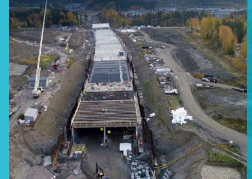
Valut etenevät Patomäen tunnelilla.