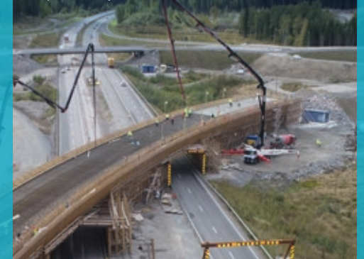
Kujalan risteyssillan valun tekoa.