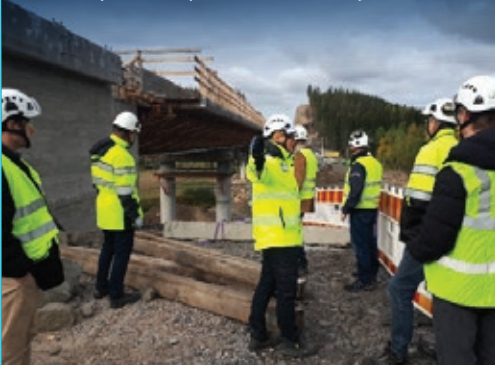
Vuoden työmaa -kilpailun raati vieraili työmaalla.