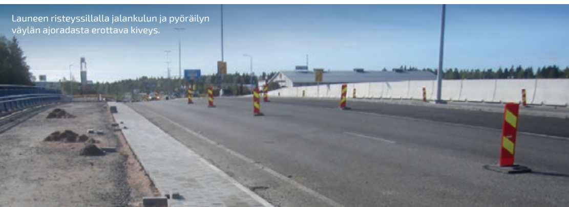
Launeen risteyssillalla jalankulun ja pyöräilyn väylän ajoradasta erottava kiveys.