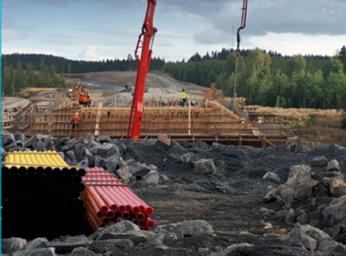
Takamaan alikukukäytävä valettu.

VIIKON ONNISTUMISET: Hankeosan kaikki valtatie 12 suuntaiset sillat on valettu.