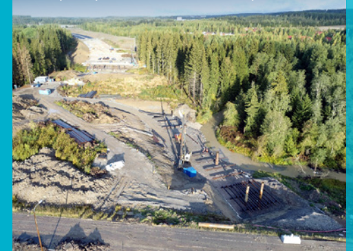
Siltatyöt käynnissä Nikulan eritasoliittymässä.

VIIKON ONNISTUMISET: Nikulan risteyssillan paalutuspedien valmistuminen.