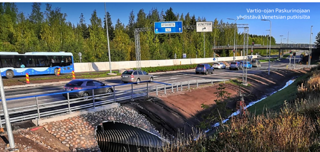
Vartio-ojan Paskurinojaan yhdistävä Venetsian putkisilta