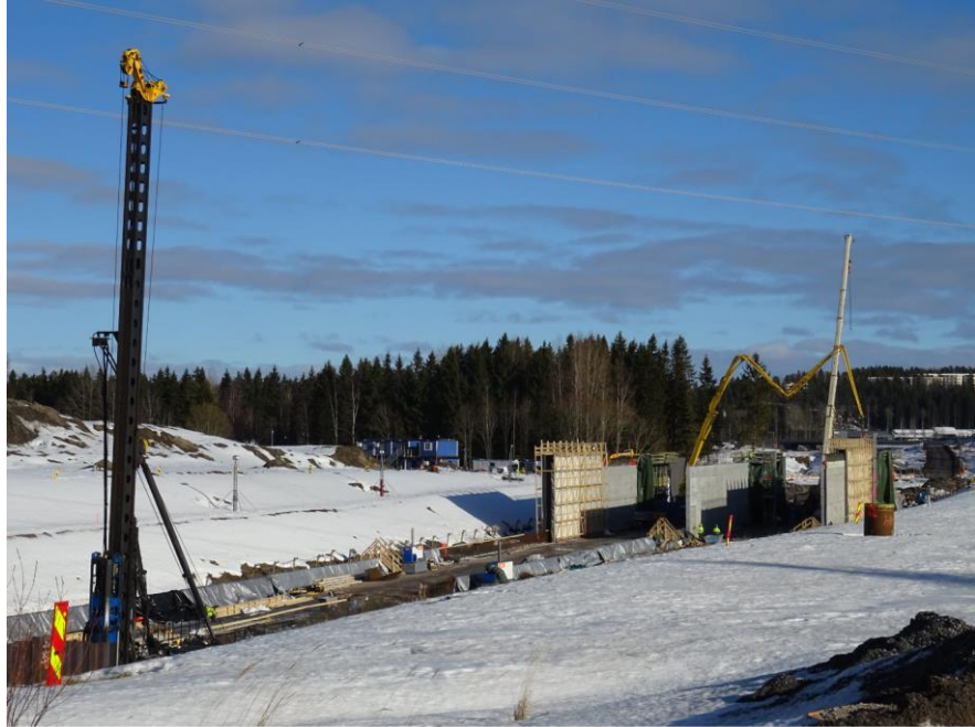
Kuva 4. Patomäen betonitunnelien seinien valua