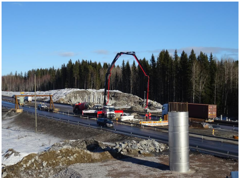
Kuva 3. Kujalan risteyssillan välituen anturan valu

Sillanrakennustöitä tehtiin usealla sillalla: Kujalan risteyssillalla sekä Por-voonjoen ylittävillä Ali-Juhakkalan silloilla rakennetaan maa- ja välitukia.