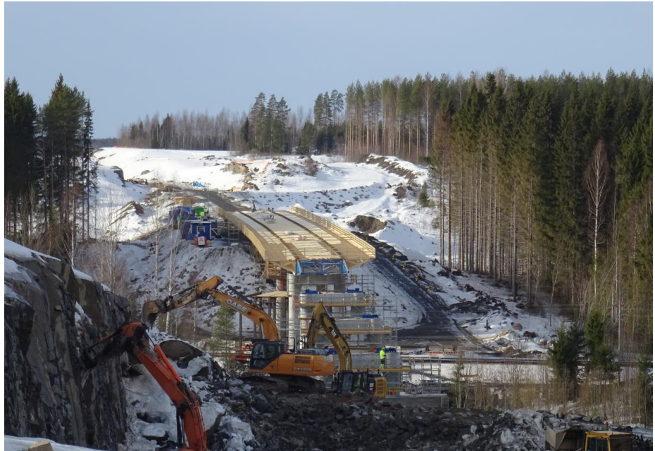
Kuva 1. Vähäjoen risteyssillan kannen ensimmäinen osa tunkattuna radan yli