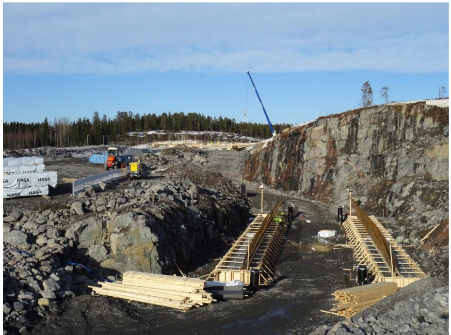
Kuva 2. Soramäen alikulkukäytävä, taustalla Soramäen risteyssillan kannen muotti.