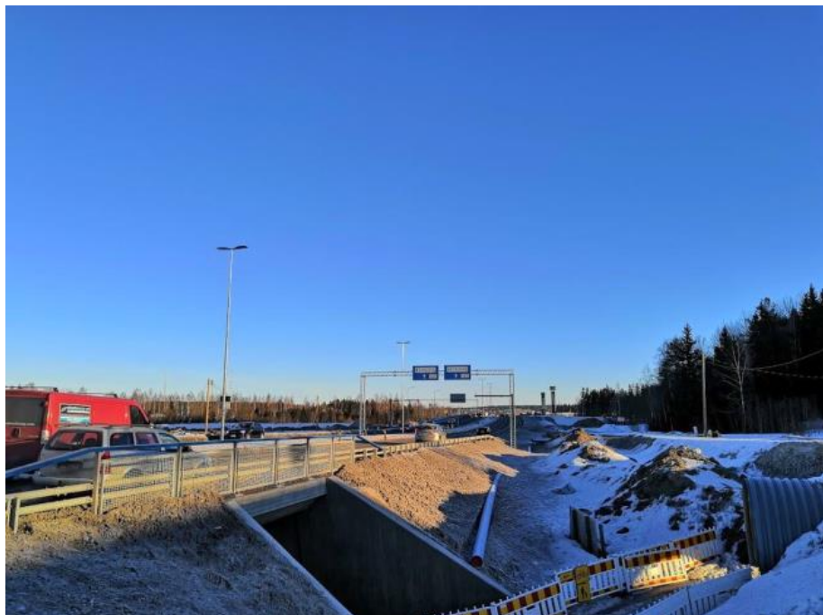
Kuva 6. Uudenmaankatu Patomäen alikulkukäytävän kohdalla