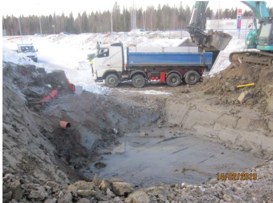
Kuva 5. Hulevesipumppaamon kaivutöitä Aukeankadun alikulkukäytävän luona