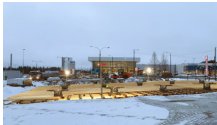
Kuvassa tehdään Hankaankadun risteyssillan kannen telinettä.