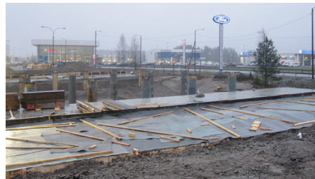
Silta s1 Renkomäen ABC:n kohdalla.