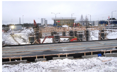
Silatyöt Renkomäen ABC:n kohdalla etenevät hyvin.