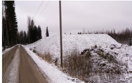
Penkereet kuin ilvekset... tässä ensimmäinen...

Kuluneella viikolla valtatiellä 4 on tehty mittauksia ja jatkettu pohjatutkimuksia tulevan kehätien linjauksella. Kujalan alueella koepengerten rakennustyöt ovat edenneet suunnitelman mukaan ja toinenkin kahdesta koepenkerestä on saatu valmiiksi. Kaivokartoituksiakin on jo ehditty aloitella viikon aikana.