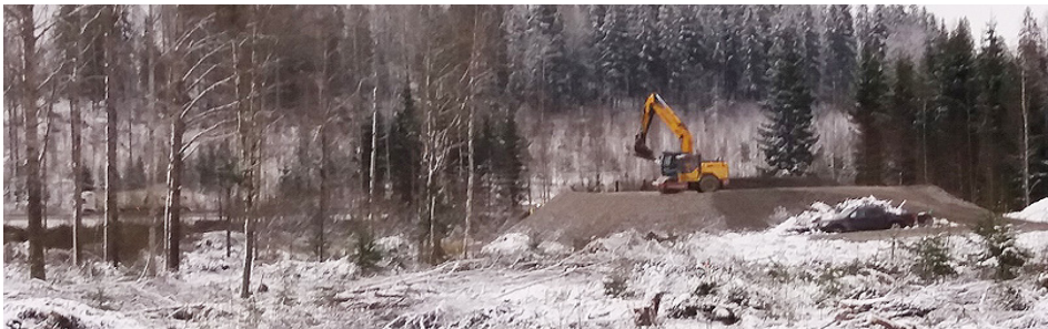
...ja tässä toinen koepenger.