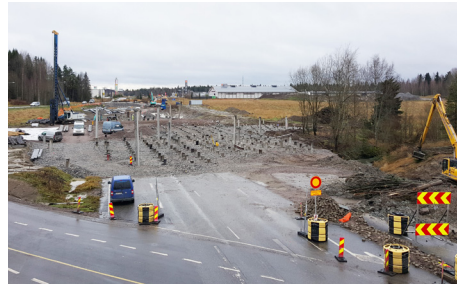
Launeella paalutustyöt jatkuvat.