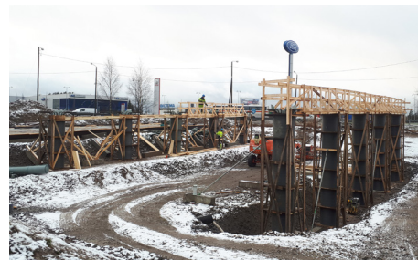
Siltatyöt etenevät Renkomäen ABC:n kohdalla.