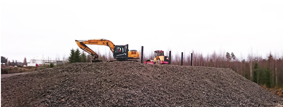
Ensimmäinen koepenger on nyt valmis.

Tällä viikolla suunnittelutyöt ovat jatkuneet liittyen esimerkiksi siltatöihin, teknisiin järjestelmiin ja tunneleihin. Kujalan alueella on tehty pohjatutkimuksia ja rakennettu ensimmäinen koepenger. Ensi viikolla aloitetaan toisen koepenkeren rakentaminen. Penkereet ovat osa tulevaa tierakennetta. Lähikuukausina niiden painumaa ja siirtymiä mitataan ja tutkitaan eri mahdollisuuksia optimoida kehätien pohjanvahvistusratkaisuja.